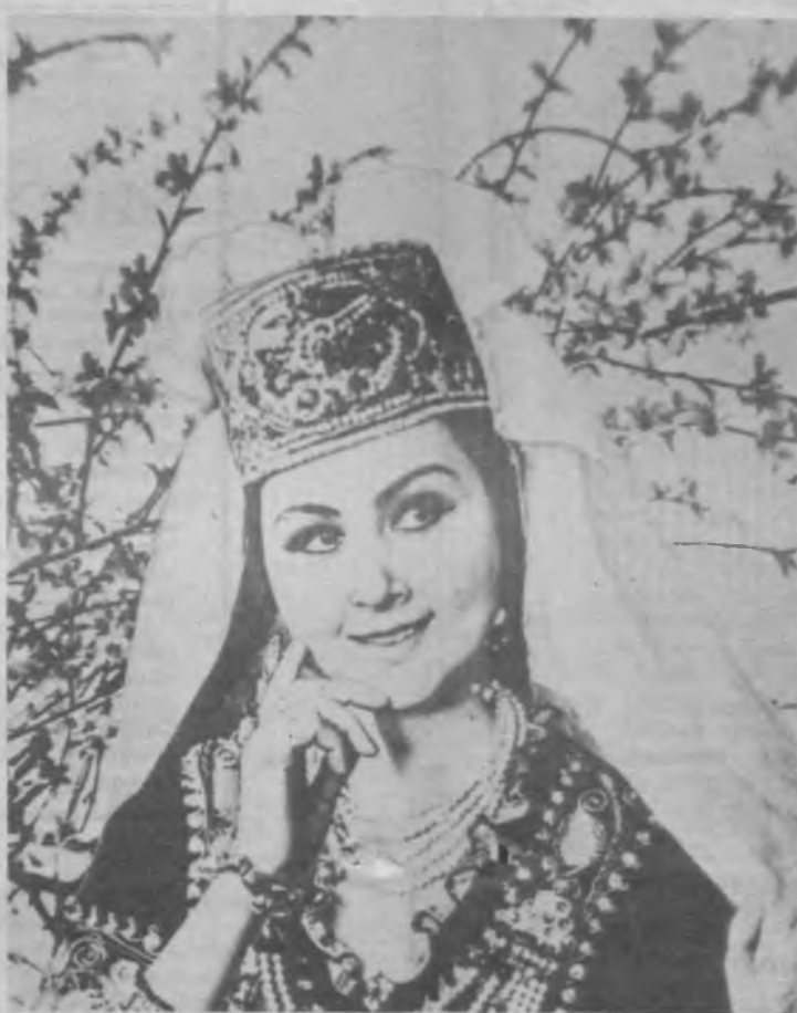
● СИЗГА ХУРМАТ, СИЗГА ИЗЗАТ, СИЗГА ШАРАФ, СИЗГА ШОН!