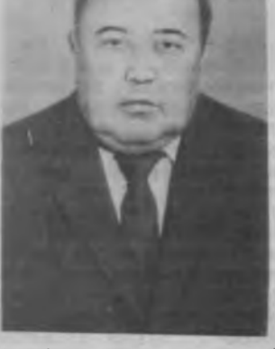
— Ҳой, Ойсара хола! Колхозимизда янги раис келгани риза бўлдими? Жуда бообру одам дейишгилми...