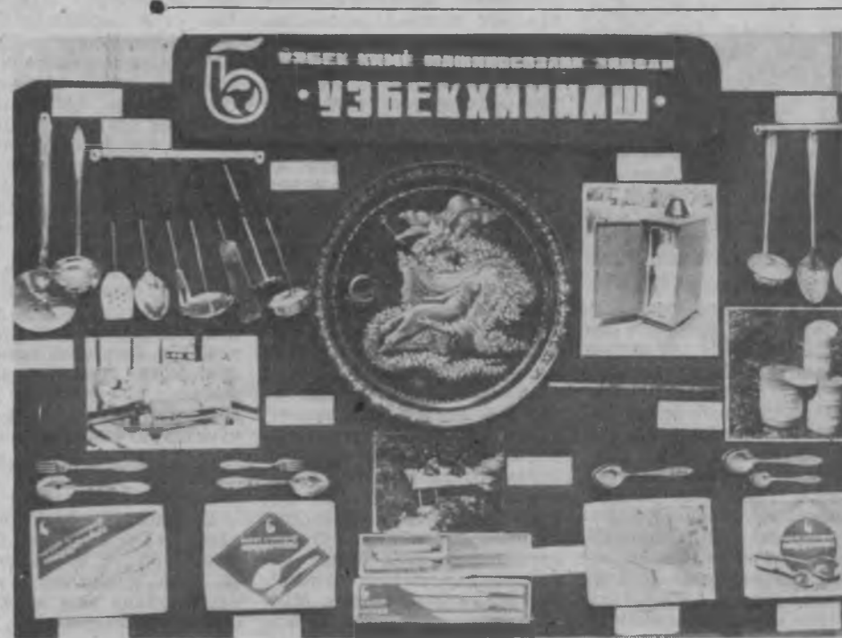
• ВИЛОЯТ фаоллари йиғилиши қатнашчилари шу ерда ташкил этилган кейг истеъмол моллари кўргазмасини катта қизқич билан томоша қилдилар. Бу ерда вилоятимиз корхоналарида ишлаб чиқарилган юз-лаб хил турли-туман буюмлар намойиш қилинган эди.