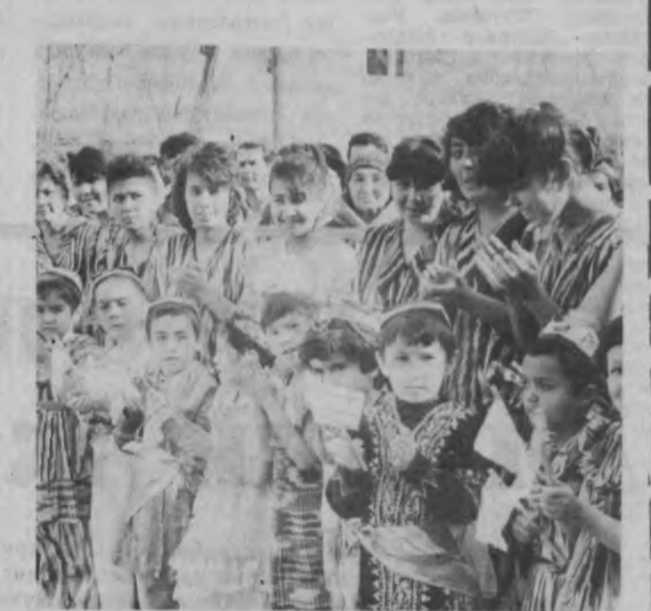
УШБУ суратлар Пискентда янги шифохона ва «Ширинтой» ҳамда «Наврўз» болалар боғчаларини фойдаланишга топширишга бағишлаб ўтказилган тантанали йилгилишларда олинган.