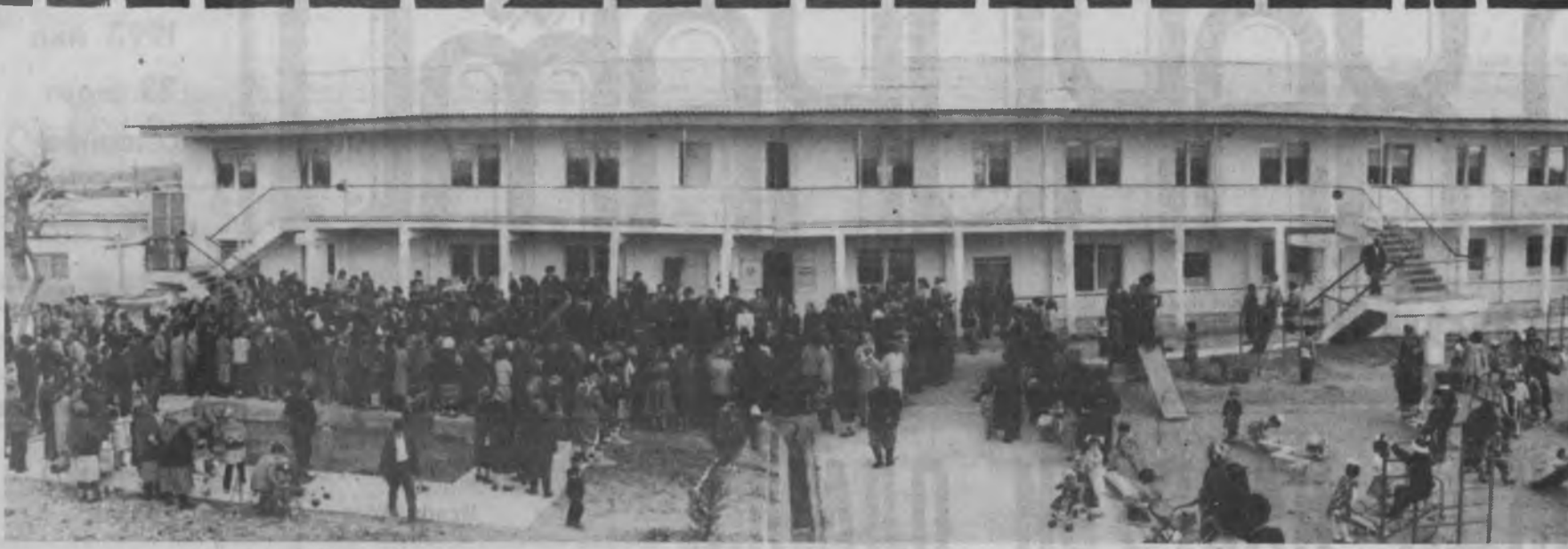
(Давоми. Бошқ 1-бетда.)

Аҳоли учун хизмат кўрсатаётган айрим шифохоналар. — деди А. Носиров. 1913 йилда қурилган. Ундан кейингилари эса амаллаб мослаштирилган бинолар. Вундай шифохонада беморлар ва тиббиёт ходимлари учун мутлақо шароит йўқ эди. Зарур бўлган тиббий асбоб-ускуналарнинг йўқлигини гапириб ўтирмаса ҳам бўлади. Пискентликлар ани шундай оғир бир шароитда янги шифохонани сабр-бардош билан кутдилар. Мана, ниҳоят уларнинг орзуси ўшaldi.