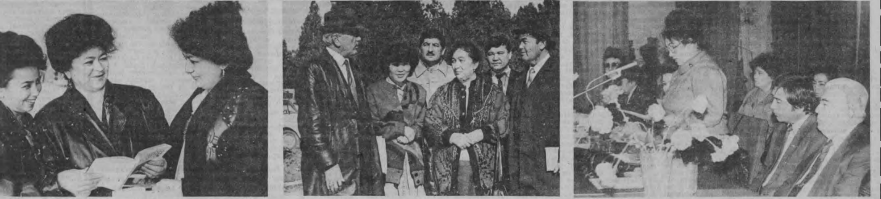
СураТларда: шифокорлар анжуманидан лавҳалар.

Бу тарзда она учун ҳам, бола учун ҳам қўлайлик таъминланади. Фарзанд туғилгандан сўнг аёл умр йўлдошини кўриши эса уни бемажолликдан ва рўй бeриши мумкин бўлган бош-қа дардлардан ҳалос этади. Мен бу мисолларни бизда гинекология, акушерлик хизмати қолқоқ деган маънода гапирмайман. Республикада бу борада ан-