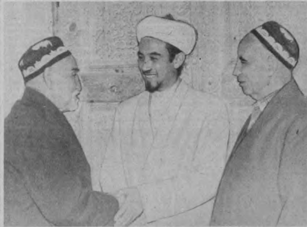
ТОШКЕНТ — МАРКАЗИЙ ОВРУПО