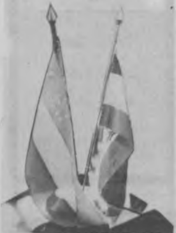
(Давомий Боши 1-бетда)

Баҳорнинг кўрки-тароватидан тенги йўқ чирой касб этган она табият бу кўшни вилоят шаҳар ва қишлоқларига ҳам фусункор гўзаллик бахш этибди. Йуллардаги қадимий шарқона қишлоқлар, кенг қир-адирлар, яшил либос кийган боғ-роғлар, анвоий мевазорлару, бир-биридан сўлим гўшалар, оппоқ либос кийиб, ҳосилини кўз-кўз қилиб турган ўрикзор ва шафтолизорлар, кўзда баракали хирмон вада қилгандек лорсиллаб ётган бўлиқ даладар... Энг муҳими — қўл силки-тиб кулиб боқиб турган меҳмондўст одамлар, ўз оғанилари таширидан мамнун бўлган тожик дўстларимизни ҳар қадамда кўрганмиш сари баҳри дилимиз очилиб боради... Манзила яқинлашган сари ҳис-ҳаяжонлар ҳам тугён кўтарарди.