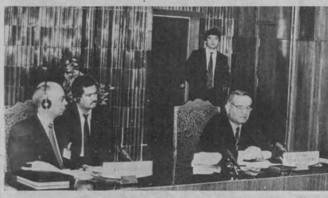
Суратларда: анжуман пайти.