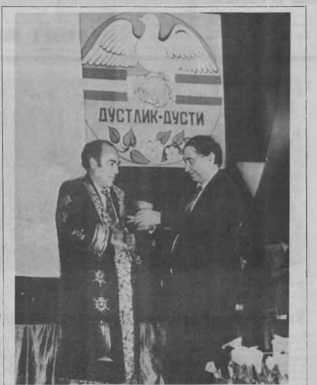
Икки вилоят раҳбарлари навбатдаги учрашувларининг биринчи.

Тошкент вилояти вакиллари ва халқ депутатлари Ленинобод вилояти кенгаши ижроия қўмитаси раҳбарлари раиси фабрика ишчи-хизматчиларига икки томонлама ўзаро ҳамкорликни кенгайтириш тўғрисида тузилган шартномаларда жуда кенг қамровли масалалар белгилаб олинганлигини айтдилар. Дарҳақиқат, бозор иқтисодиётига ўтиш жараёнида икки вилоятнинг бир-бирига берадиган кўмағи жуда катта аҳамиятга эгадир. Бу борадаги қаракатларни мувофиқлаштириш фақат фойда келтиришини барча таъкидлади. Бу ерда меҳнат қилаётган кўл сонин ишчиларнинг Тошкент ва Ленинобод вилоятлари ўртасидаги катта йўлнинг чиройи ҳамisha нурафшон бўлишини, бу йўл фақат эзгулик