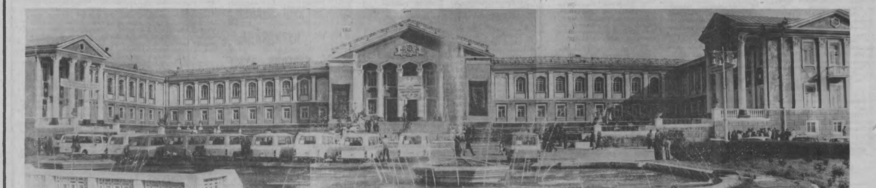
Бу муқаддас бино Хўжанд районидagi Саидхўжа Ҳурунхўжаев номли жамоа кўжалигининг «Арб» маданият саройидир. Ушбу сарой жуда кўп тарихий воқеаларнинг гувоҳидир. Тожикистон Республикаси Олий Кенгашининг факультетда ун олтинчи сессияси ҳам шу ерда ўтказилган. Ленинободликларнинг фириҳча, шундан кейинги иккинчи тарихий воқеа Тошкент ва Ленинобод вилоятлари ўртасидаги ҳамкорлик шартномасининг айни шу ерда имзоланиши бўлди.