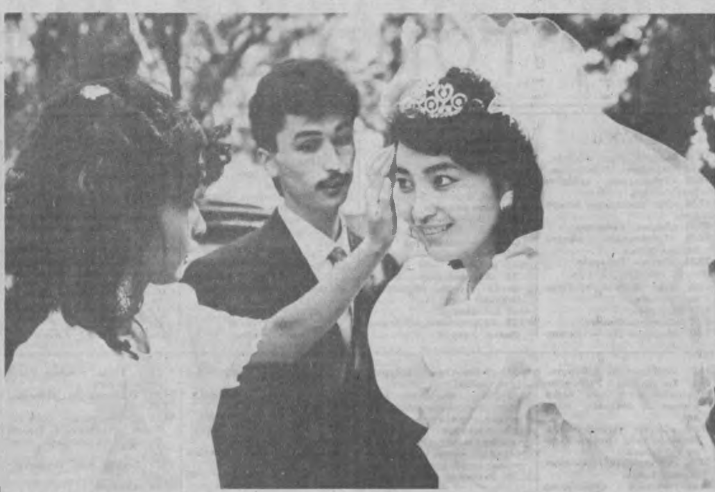
Бахтли бўл, дугомажон...

Бу йил республикамиздаги энг кекса зиё масканидан бири бўлган Турон номи Тошкент вилоят кутубхонаси 75 «ёшга» тулади. Кутубхона жамоаси бу кутлуғ санани муносиб нишонлаш учун пухта таралдуд кўрмоқда.