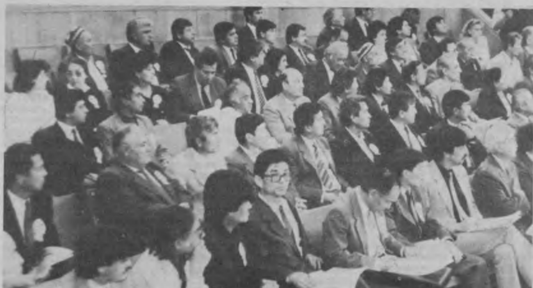
СУРАТЛАРДА: (ўнгда) «Заман» газетасининг бош директори Ножи Тўсун; (чапда) мажлислар залда.