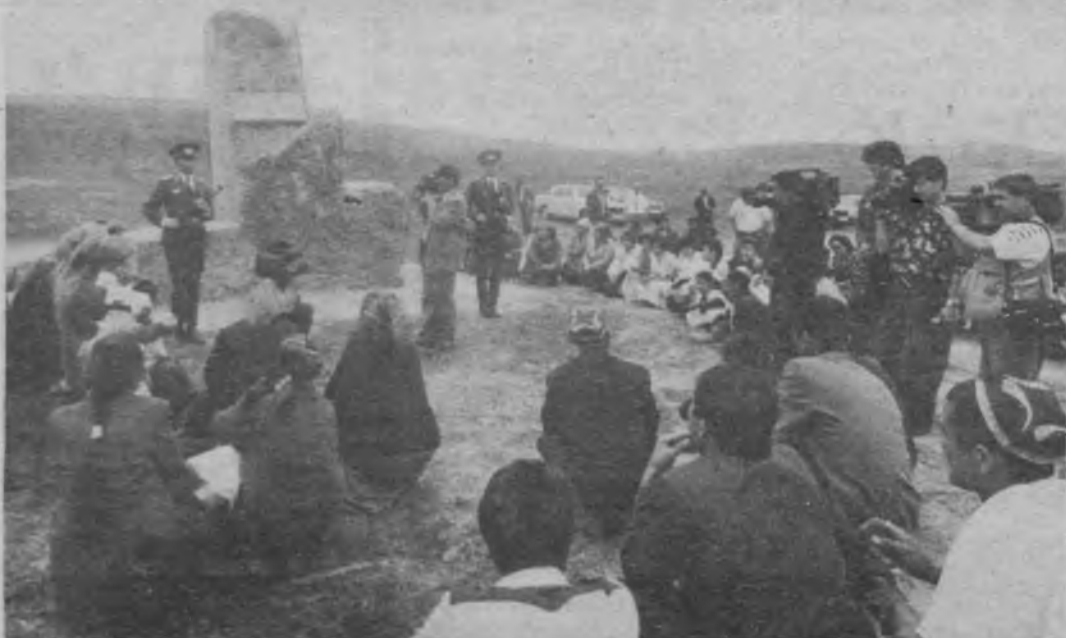
● СУРАТЛАРДА: Ёдгорликнинг очилиши маросимидан лавҳалар.