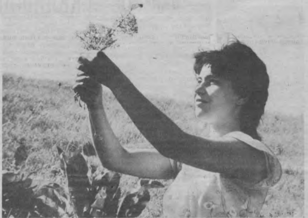
● БУСТОНЛИҚДА баҳор.

ган ахлатдан қурилган. Иккинчидан, қувурлар орқали иссиқхонага узатиб берилган иссиқлик ҳам махсус станцияда худди шу ахлатни ёқишдан олинмоқда. «Фото-Япония» — журнали шу ҳақда хабар беради.