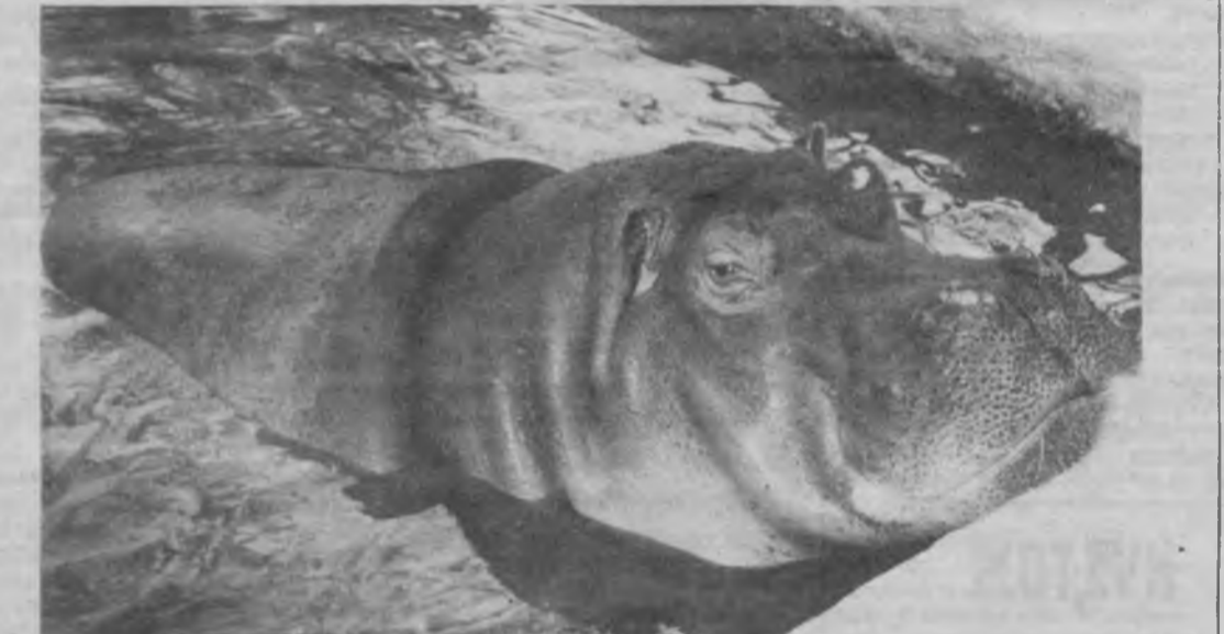
ТОШКЕНТДАГИ ҳайвонот боғида дунёнинг турли бурчалардан келтирилган жонивор сақламоқда. Бу ерда келган кексаю йшлар бошқа ҳайвонларнинг асосли бегемотлариникидан қимбатроқ томоша қиладилар.