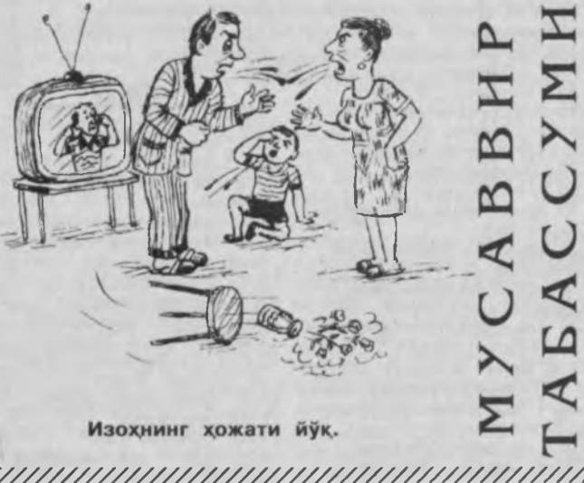
Изоҳнинг ҳолати йўқ.

Онаси: — Мен ҳозир сенга лайлак тумшугида олиб келган кичкина укангни кўрсатаман. — Нима, ука кўрмабманми, — тўнғиллади бола. — Менга лайлакни кўрсатинг.