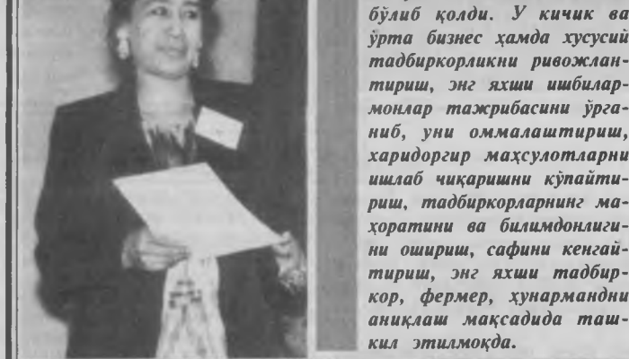
Танлов республикаимиз Президентининг кичик ва ўрта тadbиркорликни ривожлантириш, уларга кенг имкониятлар ва имтиёзлар