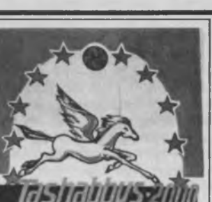
риб, билим даражаларини ҳам намойиш қилдилар.

Шунингдек, уч йўналишда бўлиб ўтган беллашувнинг 2000 йил ғолиблари аниқланди.