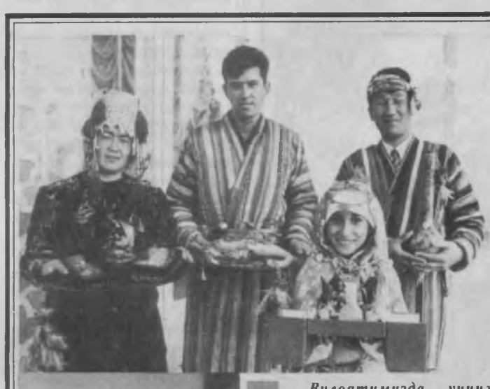
Вилоятимизда, унинг тумани ва шаҳарларида ҳар йили "Ташаббус" танловини ўтказиш яхши анъана бўлиб қолди. У кичик ва ўрта бизнес ҳамда хусусий тadbиркорликни ривожлантириш, энг яхши ишбилармонлар тажрибасини ўрганиб, уни омалаштириш, харидорлар махсулотларини ишлаб чиқаришни кўпайтириш, тadbиркорларнинг маҳоратини ва билимдонлигини ошириш, сафтини кенгайтириш, энг яхши тadbиркор, фермер, хўнарамандни аниқлаш мақсадида ташкил этилмоқда.