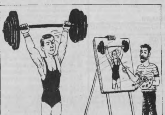
— Яна озгина чида, огайни, битай деб қолди. Абдурашул ҲАКИМОВ чизган суратлар.