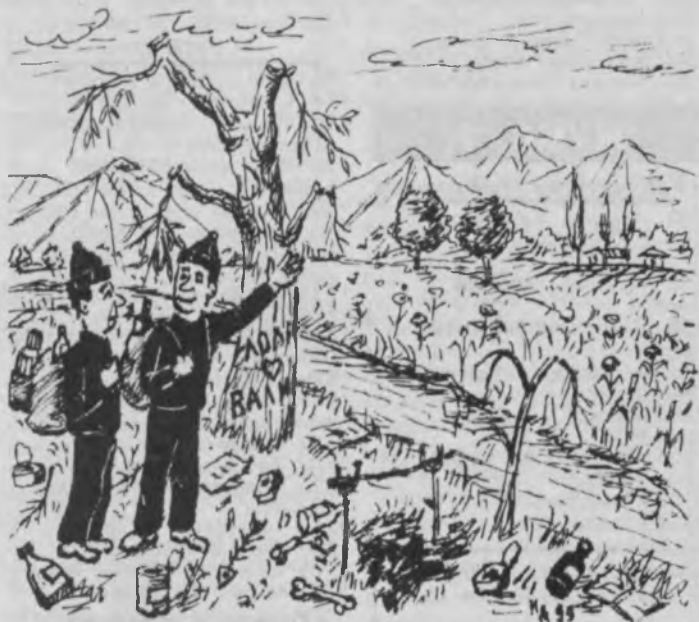
— Сайёҳлар анхорнинг нариги бетига ўтишмаган экан. Юр, ўша ёққа кетдик. Биздан ҳам из қолсин-да.