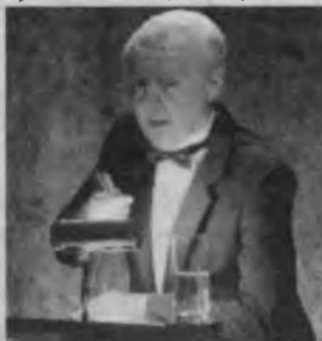
(ЖАҲОН ОММАВИЙ АХБОРОТ ВОСИТАЛАРИ ХАБАРЛАРИ АСОСИДА ТАЙЁРЛАНДИ).

Америкалик кўзбойлоғич Дэвид Копперфилднинг ажабтовур фаолияти намуналаримиз ҳам лол қолдирмаган дейсиз?! У ўз қобилиятини яна бир соҳада ҳам қойилмақом қилиб намойиш этди. Германияда ўтказиладиган лотерея ўйинларининг бирида ютуқ чиқадиган рақамларни олти ой илгари аниқ айтиб берди. Унинг бундай башоратини сир сақлашга келишилди ва гувоҳлар иштирокида конвертга солиниб муҳрланди ва пўлат сандиққа беркитиб қўйилди. Лотерея ўйини бўлиб ўтгандан кейин конверт очиб кўрилганда Копперфилд тўла ҳақ бўлиб чиқди. Бунга қандай эришганининг сирини сўраганларида «Бу осон. Кўпчилик одамлар ўз миялари имкониятларининг бор-йўғи ўн фоизидан фойдаланадилар» деб жавоб берди.