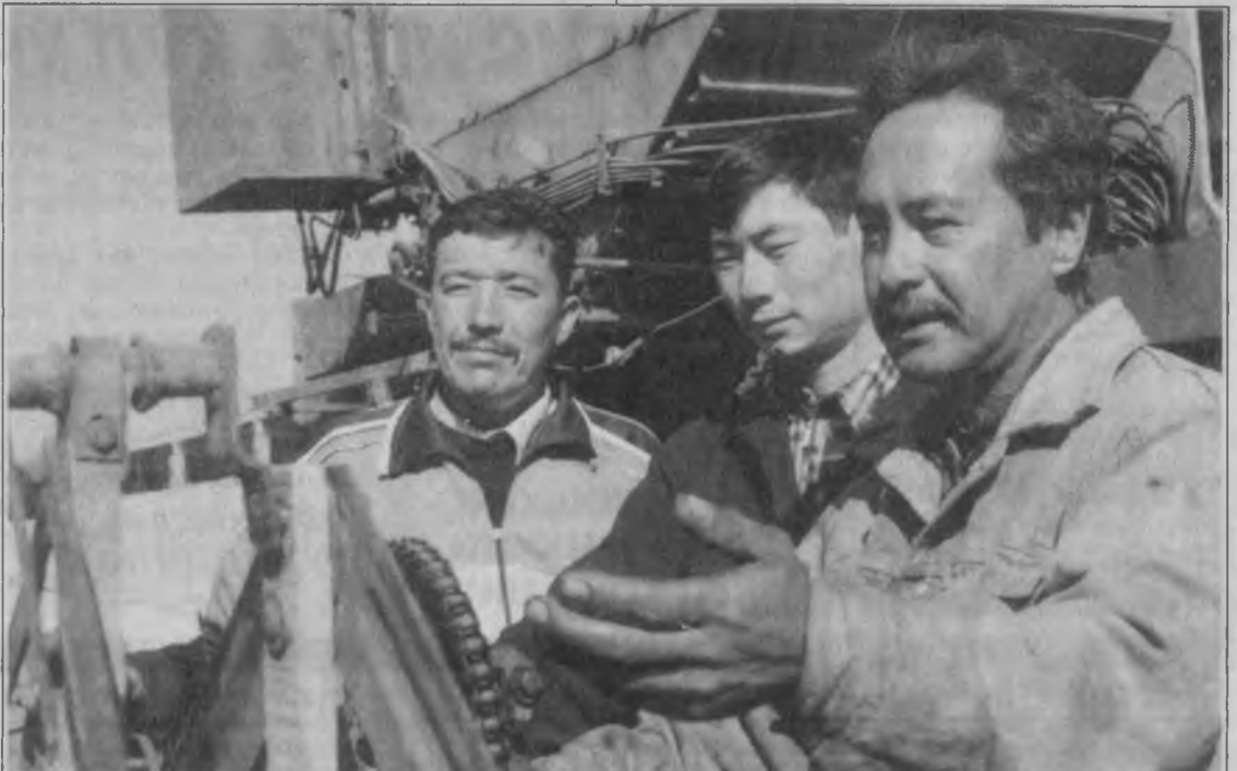
(Давоми. Боши 1-бетда).