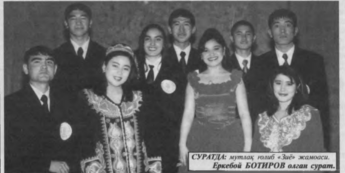
СУРАТДА: мутлақ голиб «Зиё» жамоаси.

Барчамиз умумхалқ ҳашарида фаол иштирок этайлик!