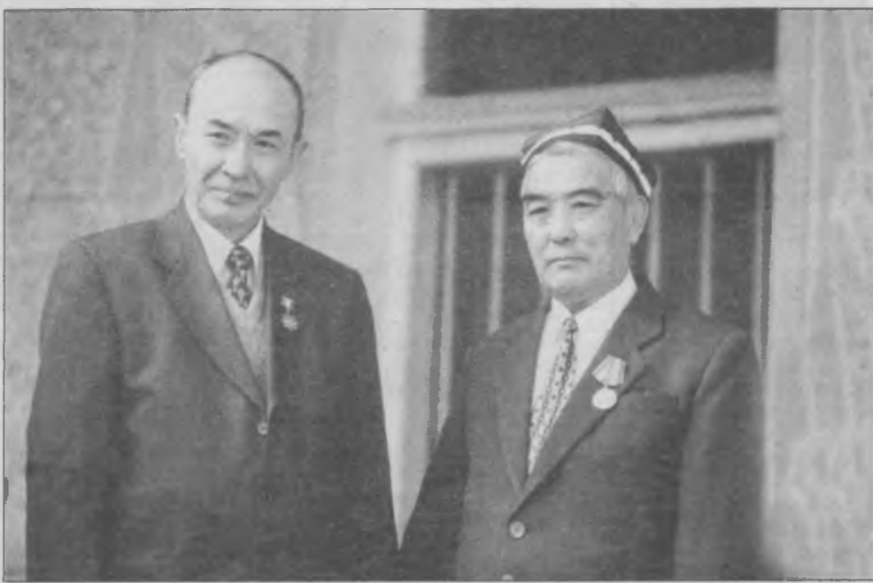
СУРАТДА: Барот Исроил Ўзбекистон халқ шоири, Ўзбекистон Қаҳрамони Абдулла Орипов билан.

Қуйида шоир ижодидан намуналар «Тошкент ҳақиқати» муштарыларига тўхфа этилаётир.