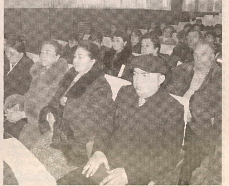
СУРАТЛАРДА: марафон ҳеч кимни бефарқ қолдирмади.