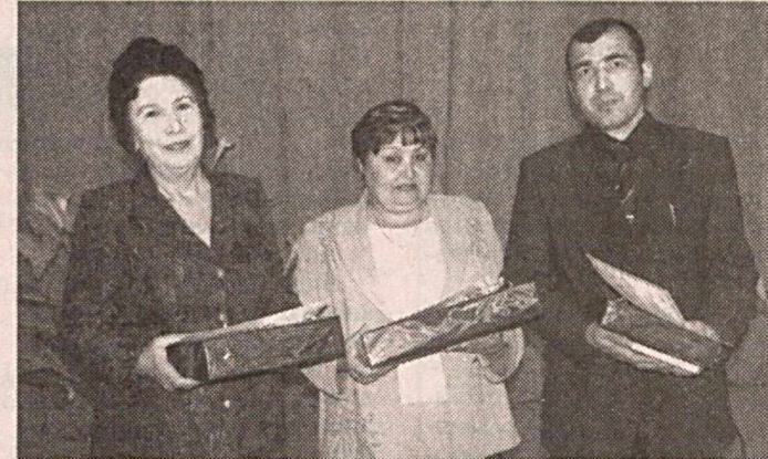
СУРАТДА: танлов ғолиблари.