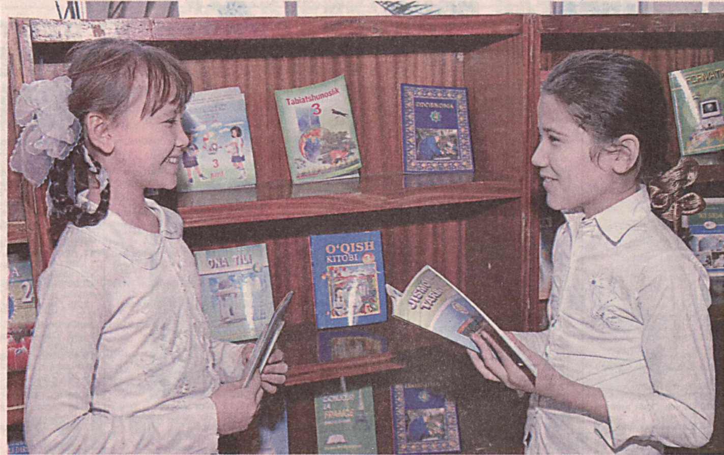
– Кутубхонада қизиқарли китоблар кўп экан, дугонажон!