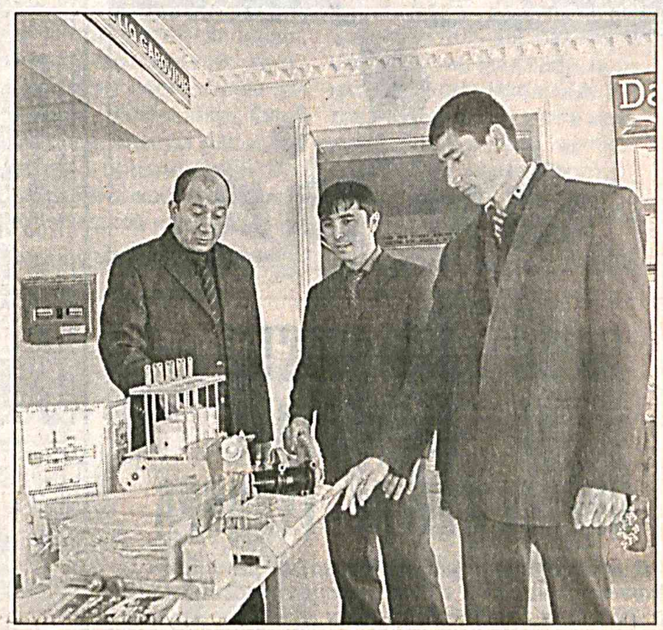
На снимках: во время работы семинара. Соб. инф.

Областное управление среднего профессионального образования ввело в практику территориальные семинары для педагогов с целью постоянного со-