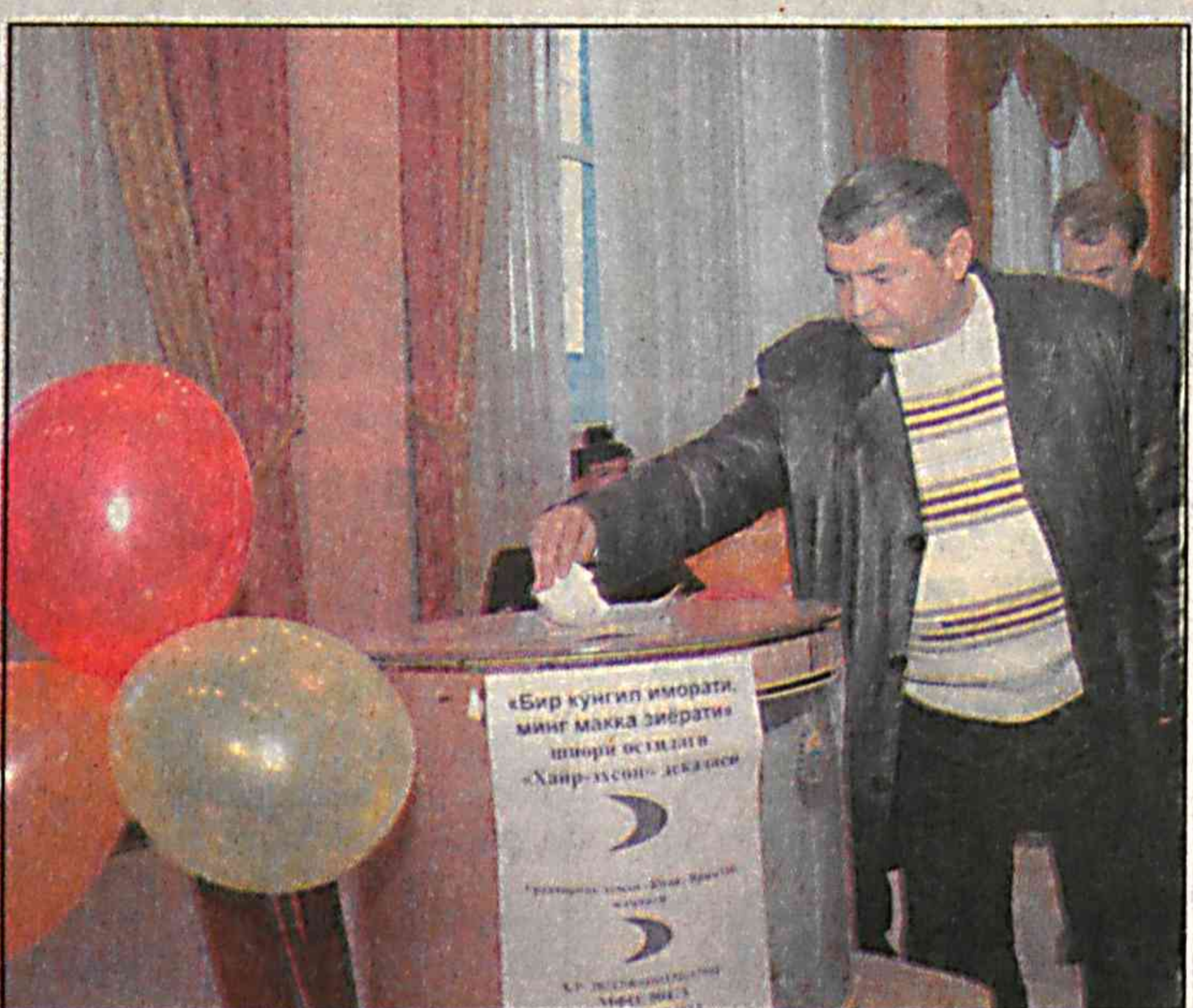
На снимках: во время прошедшей в Уртачирчикском районе в рамках областной благотворительной акции «Декада добрых дел» мероприятия по поддержке социально-уязвимых слоев населения.