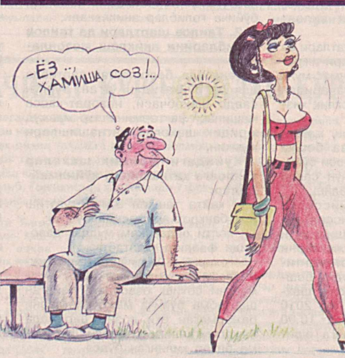
Хусан СОДИҚОВ чизган расм.

"ВОУСНЕСНАК-ВЕР'ЗОД" МЧЖ устав фондини 5 551 296 сўмдан 2 313 040 сўмга камайтирилганини маъ-лум қилади.