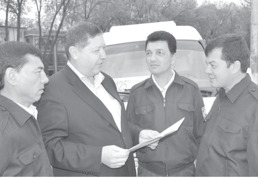
2011 йил — Кичик бизнес ва хусусий тадбиркорлик йили

Бугун мамлакатимизда барча соҳаларга тадбиркорлик фаолияти жадал кириб бормоқда. Бу эса соғлом рақобат муҳити юзага келиши ва пировардиде аҳоли турмуш фаровонлиғи юксалишида муҳим омил бўлаётди.