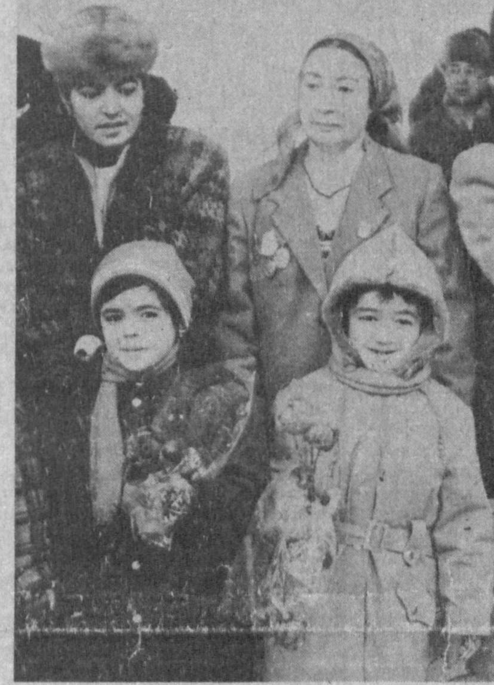
том состоялось знакомство детворы с новым домом, в котором они отныне будут на-

Музыкой и песнями в исполнении детских художественных коллективов встречали новоселов детсады, гостеприимно распахнувшие двери в канун Нового года. А по-