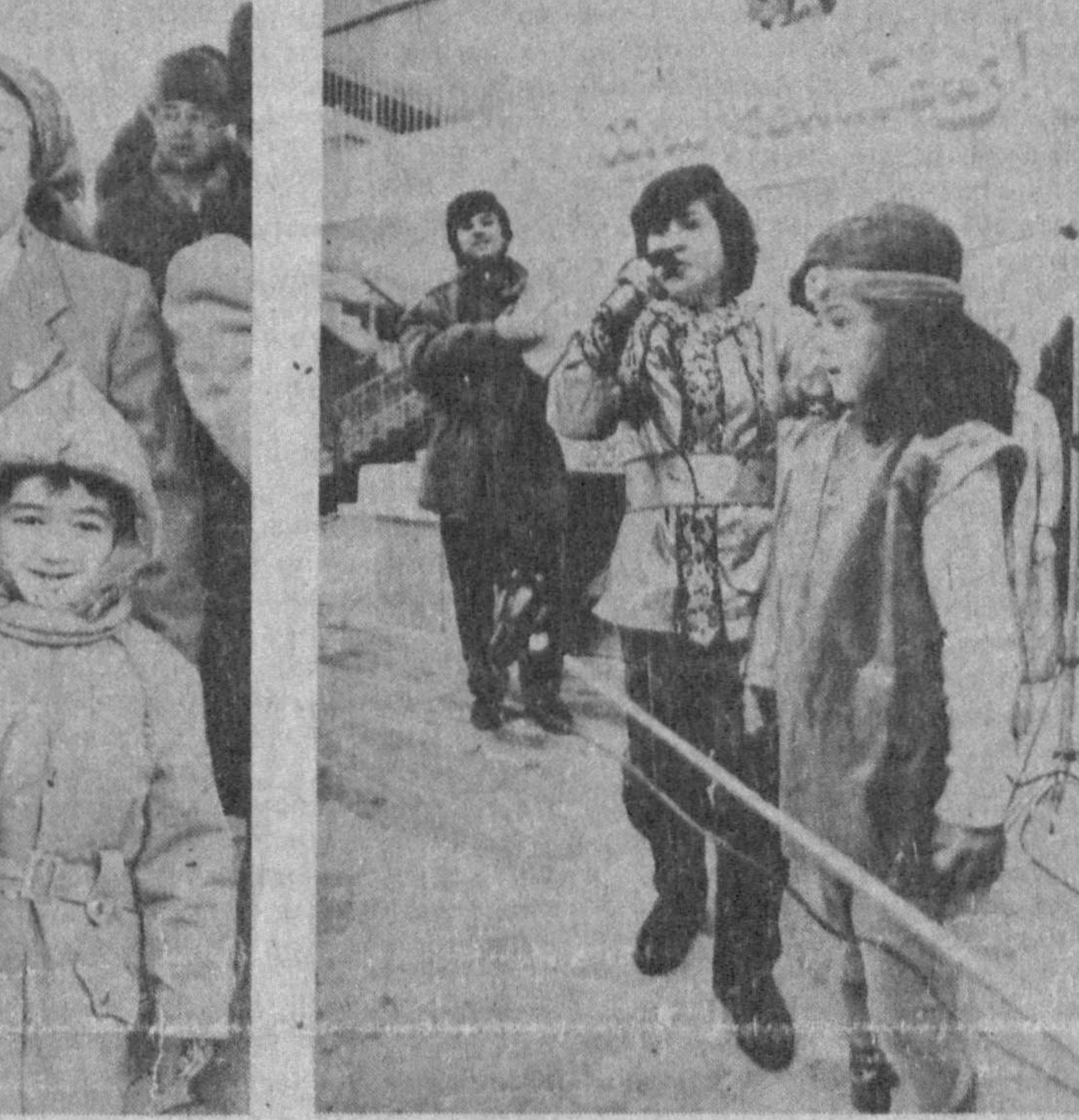
ходить, пока их мамы и папы на работе.