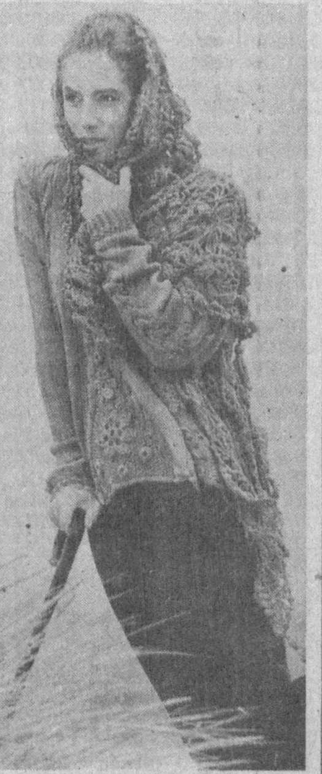
ГОЛОС ПРИРОДЫ ДИКТУЕТ МОДУ НА СНИМКЕ: свитер и шаль из овечьей шерсти с теми же элементами крупной вязки.

Чтобы избавиться от мешков под глазами, заварите в полстакане кипятка чайную ложку шалфея. После того, как шалфей настоится под крышкой, процедите отвар, половину остудите, половину согреть. Положите два куса ваты в горячий и два в холодный отвары и попеременно прикладывайте на 20 минут то холодный, то горячий компресс. Проледывайте это в течение месяца через день. Для устранения утренних отеков с вечера замочите в воде два пакета с чаем. Утром на пять минут положите их на глазницы, после чего, смазав лицо кремом, сделайте утреннюю гимнастику. Выделение пота и физические нагрузки в сочетании с такими «примочками» из чая очень быстро устраняют отеки.