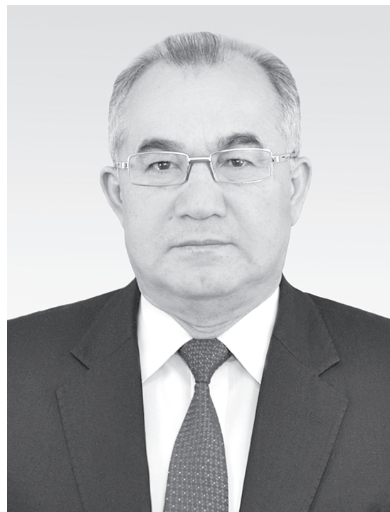
АКМАЛЬ ХОЛМАТОВИЧ САИДОВ

Кандидат в Президенты Республики Узбекистан от Демократической партии Узбекистана «Миллий тикланиш» Акмаль Холматович Саидов родился в 1958 году в Янгиюльском районе Ташкентской области. По национальности — узбек. Образование — высшее, окончил юридический факультет Ташкентского государственного университета. Доктор юридических наук. Член Демократической партии Узбекистана «Миллий тикланиш».