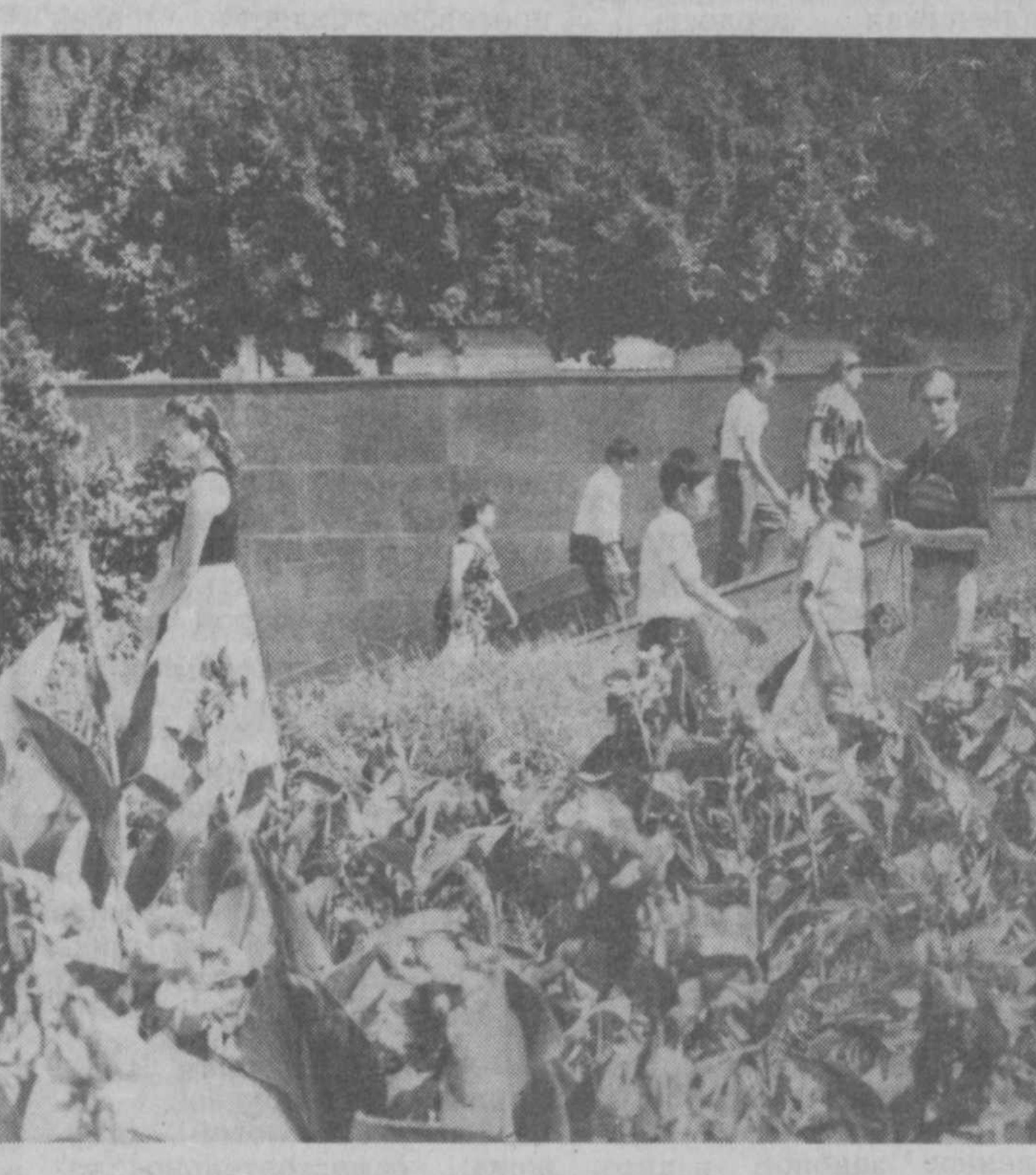
Генеральный спонсор конкурса — СП «Узвестстрой».