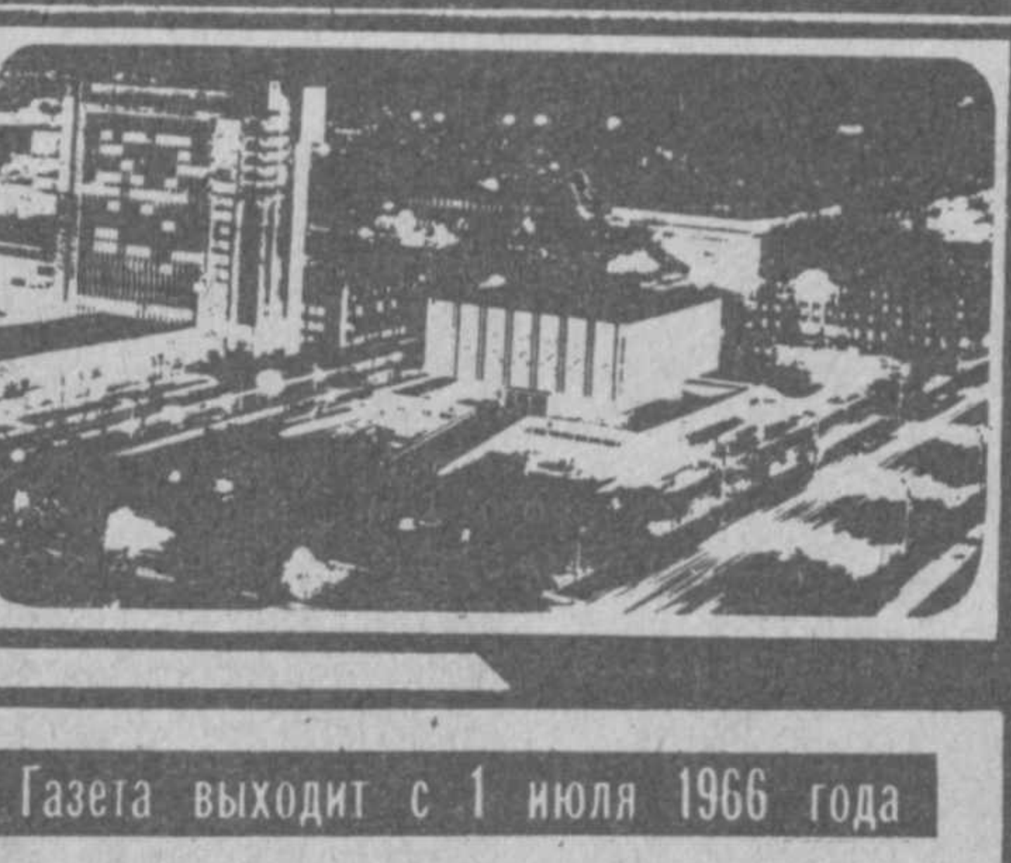
Газета выходит с 1 июля 1966 года