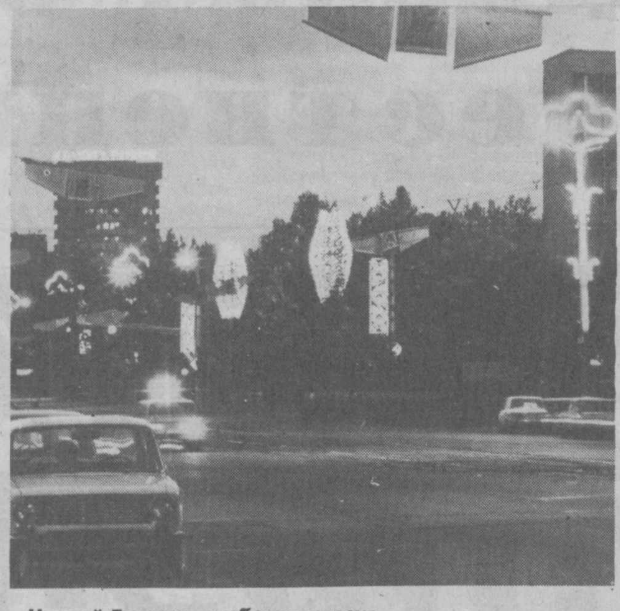
Ночной Ташкент особенно красив. Вечно молодое искусство народного танца.