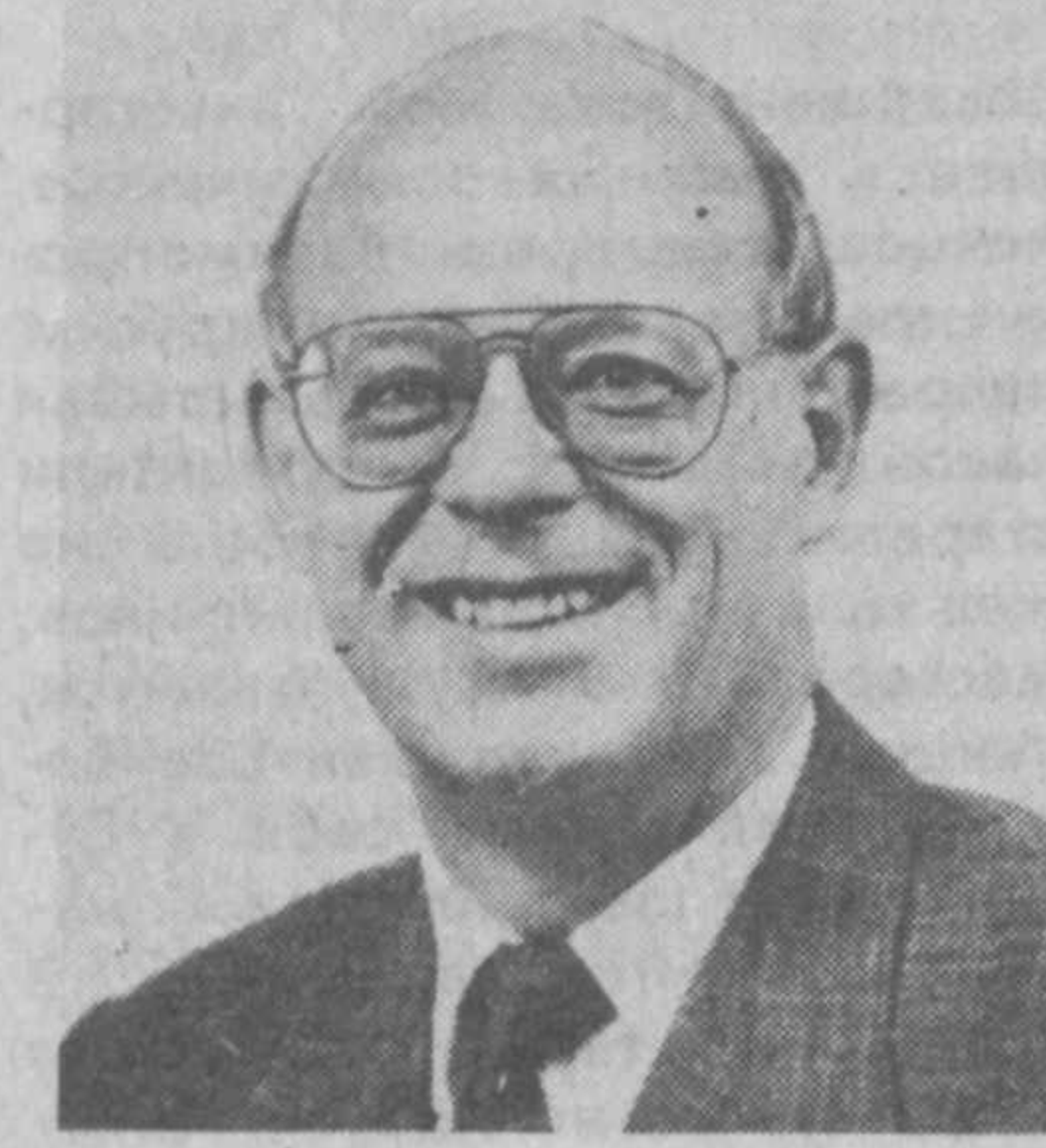
Посол Испании в Российской Федерации. С апреля 1992 г. назначен по совместительству Чрезвычайным и Полномочным Послом Королевства Испания в Республике Узбекистан. Женат, имеет сына. МИД Республики Узбекистан.

Родился 26 января 1943 года в Сео Де Урхель (Лерида). Закончил университет в Барселоне, лицензиат права. Свою дипломатическую карьеру начал в 1971 году. 1974—1978 г.г. — торговый советник в торговом представительстве Испании в Советском Союзе и первый секретарь посольства Испании в г. Москве. 1978—1982 г.г. — начальник международного департамента кабинета председателя правительства Адольфо Суареса и Леопольдо Кальво Сотело. 1982—1987 г.г. — посол Испании в Индонезии. 1987—1991 г.г. — посол Испании в Китайской Народной Республике. 1991—1992 г.г. — посол Испании в Канаде. С февраля 1992 г. — по-