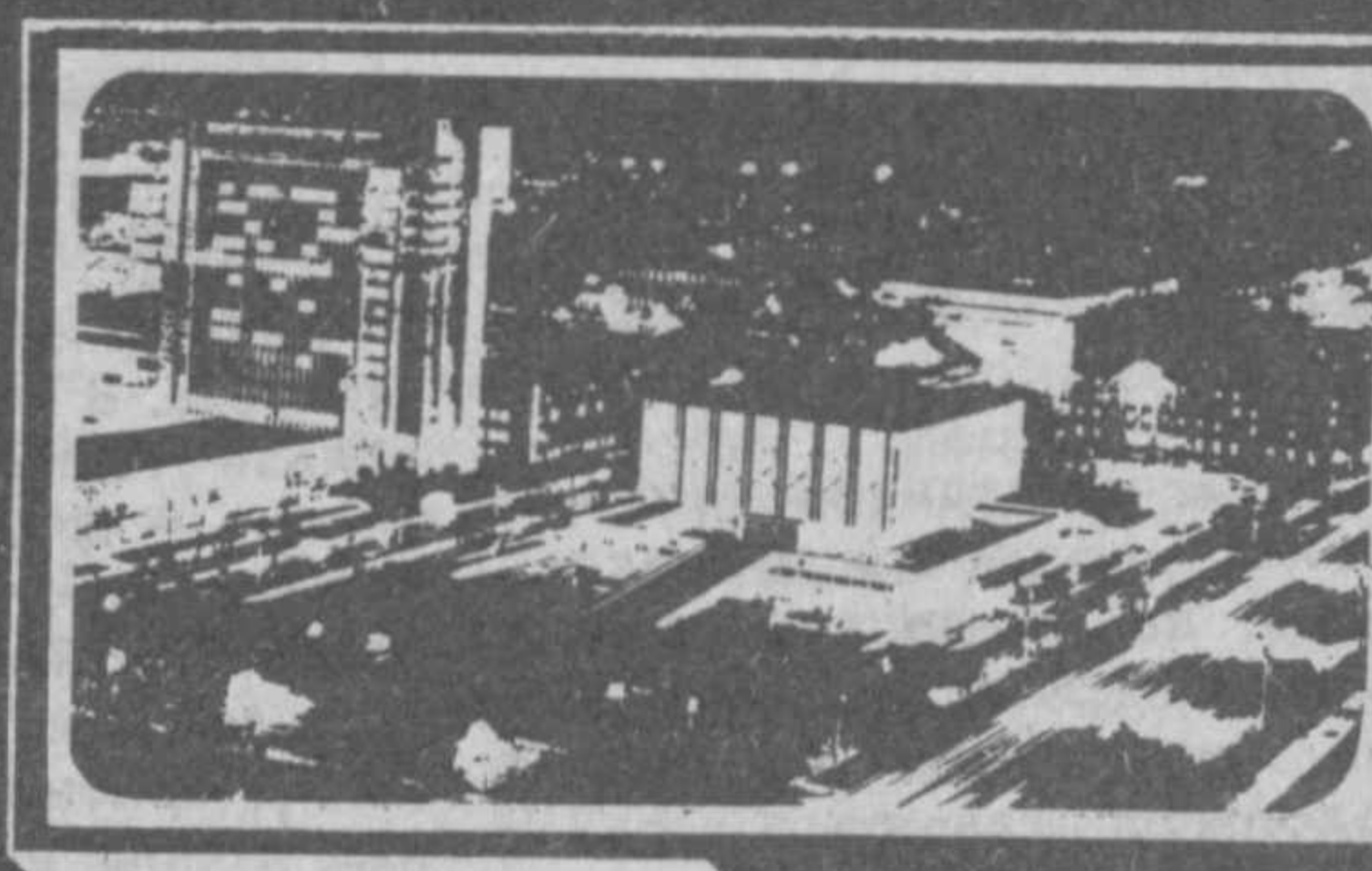
Газета выходит с 1 июля 1966 года