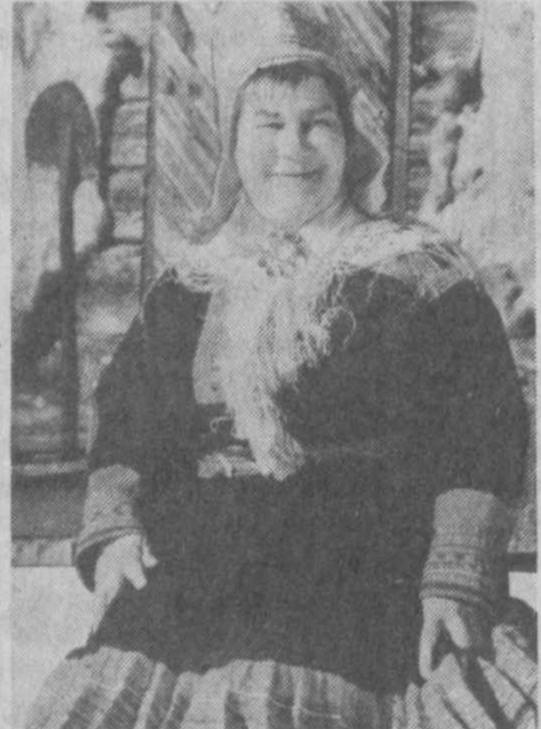
● ФИНЛЯДИЯ. Несмотря на все превратности судьбы, продолжают жить саамские народные промыслы и ремесленные традиции.