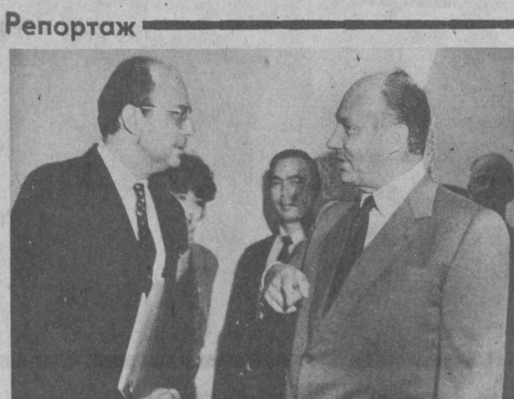
Самаркандцы давно уже привычно и довольно-таки спокойно относятся к потоку иностранных туристов, приезжающих сюда для того, чтобы увидеть неповторимые памятники истории и древней архитектуры. Однако к проведению в их городе презентации лучших архитектурных объектов они отнеслись по-особенному. И дело, видимо, не только в том, что в независимой Республике Узбекистан впервые проводилось такое значимое и грандиозное мероприятие, но и потому, что посещение Самарканда представителями фонда принца Ага Хана открывает для города новые широкие возможности для дальнейшего культурного развития.

сказал во время презентации лучших архитектурных объектов, созданных за последние три года в мусульманских странах мира, Его Высочество принц Ага Хан. И именно это, отметил он, было и есть главной целью созданного им много лет назад фонда.