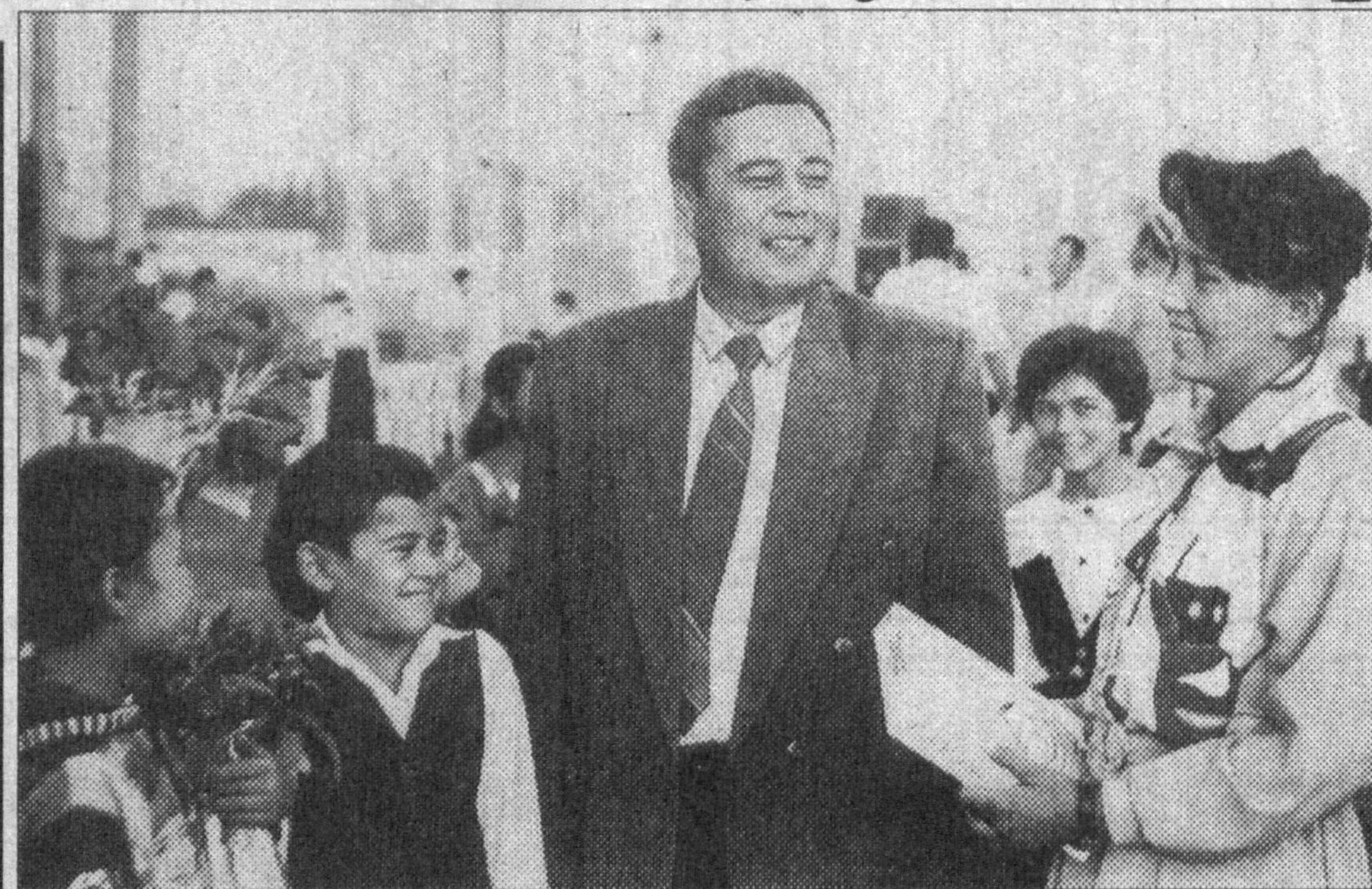
Инсон манфаатлари йилида чинозликлар гувоҳ бўлган қатор янгиликларга яна бир қувонч ҳам қўшилди. Истиқлол айёмининг шуқуҳли кунларида туманнинг «Гулзоробод» жамоа ҳўжалиги худудида 422 ўринли янги ўқув мактабини фойдаланишга топширилди. Бу даргоҳда 7-ўрта мактаб ўқитувчиларино ўқув-тарбия учун барча шарт-шароитлар мавжуд.