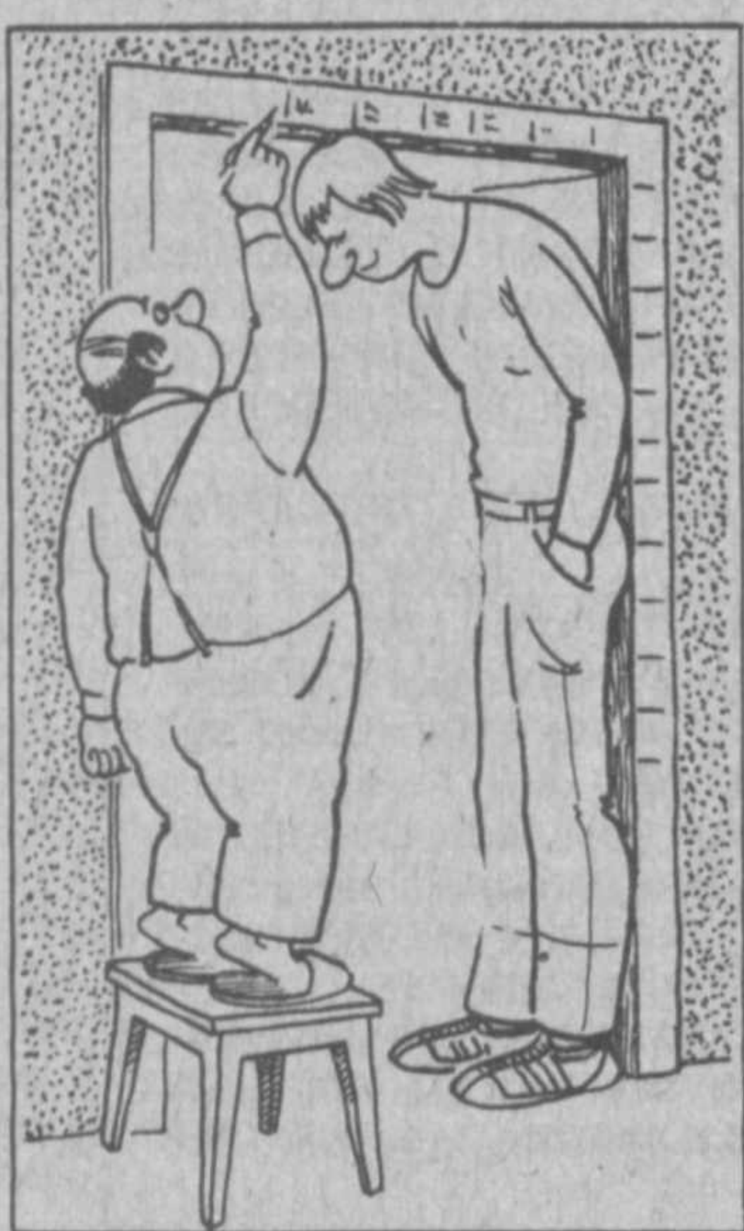
«САДО». По материалам радиостанции «Би-би-си».

высоких, но это вполне возможно, заключает статья. «САДО». По материалам радиостанции «Би-би-си».