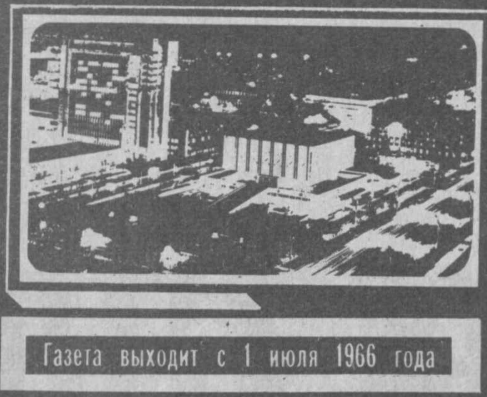
Газета выходит с 1 июля 1966 года