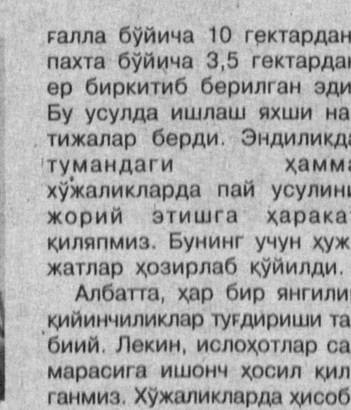
Абдугани ДЕҲҚОНБОВЕВ, Оққўрғон тумани ҳокими:

— ИҚТИСОДИЙ ИСЛОХОТЛАРНИ чуқурлаштириш бўйича республика комиссияси йиғилишида Президентимиз қўйган масалаларни биз ҳам туманимизда чуқур муҳокама қилдик. Дарҳақиқат, йиғилишда таъкидланганидек, ер ўз эгасини топмас экан, ишда ривож бўлмайди. Биз ана шундан келиб чиқиб, иш юртияпмиз. Туманда 13 та хўжалик бор. 7400 гектар ерга галла, 1450 гектар ерга пахта экидик. Туманнинг барча хўжалигида иш оилавий пудрат асосида йўлга қўйилган. Шу туфайли баҳорда рўй берган табиий офатга қарамай, 20 майда экилган пахтаимиз тўла етилди. Белгилаш йиллик режани ошириб адо этадиган даражада ҳосил тўллади. Йил бошида фаоллар маъсалахлатлашиб, ҳар бир оилага шартнома асосида