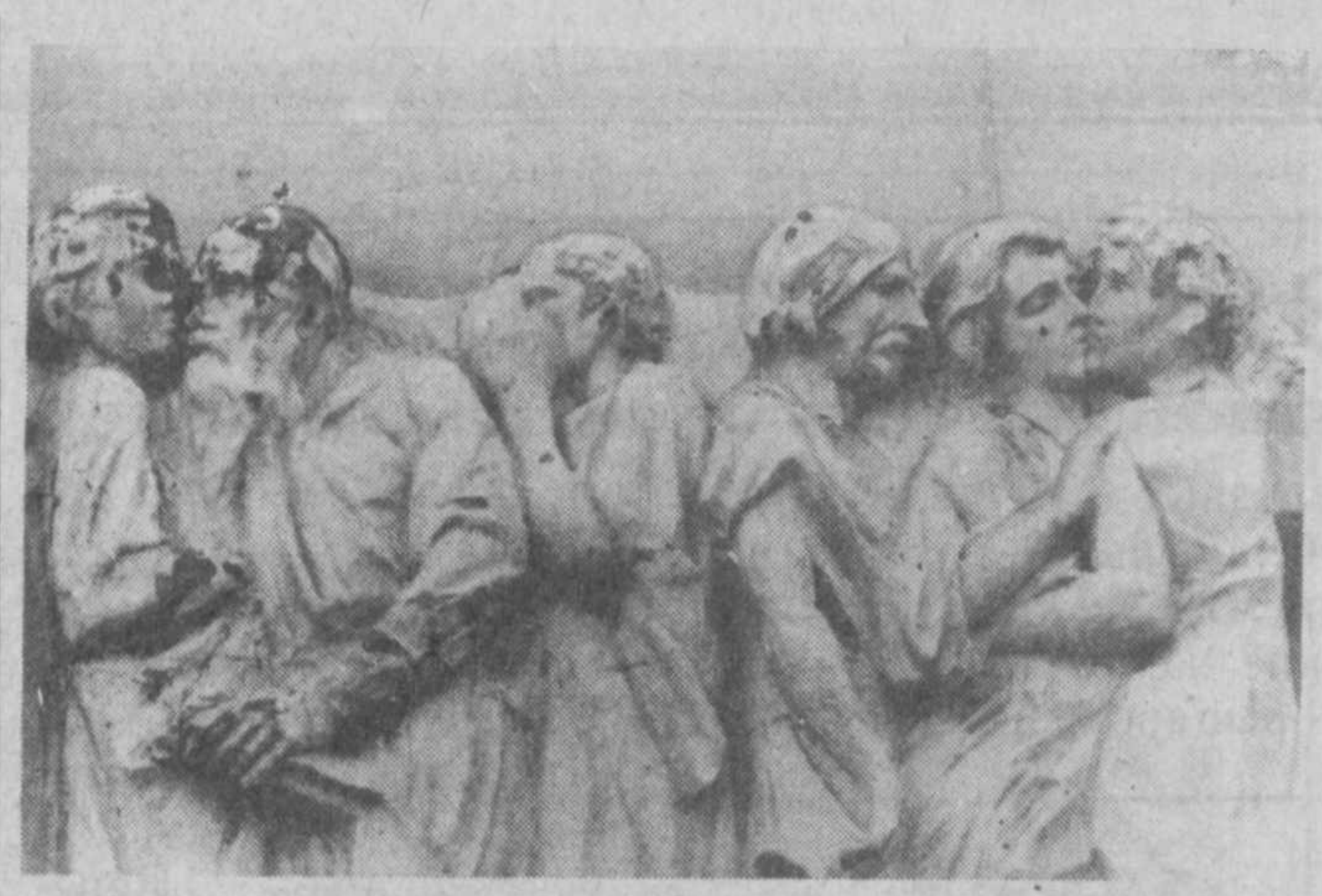
На углу Могильцевского и Плотникова переулки находится единственный в своем роде дом. На уровне его второго этажа проходит скульптурный фриз с изображением стоящих и как бы прильнувших друг к другу фигур.

Во время просмотра очередной серии телефильма о богатых, которые тоже пла-