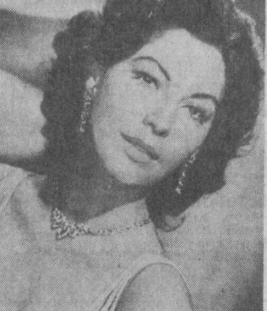
Чуть больше двух лет прошло с тех пор, как умерла звезда американского кино Ава Гарднер, знаковая советским зрителем по таким лентам, как «Синяя птица», «Снега Килиманджаро», «Обнаженная Маха».