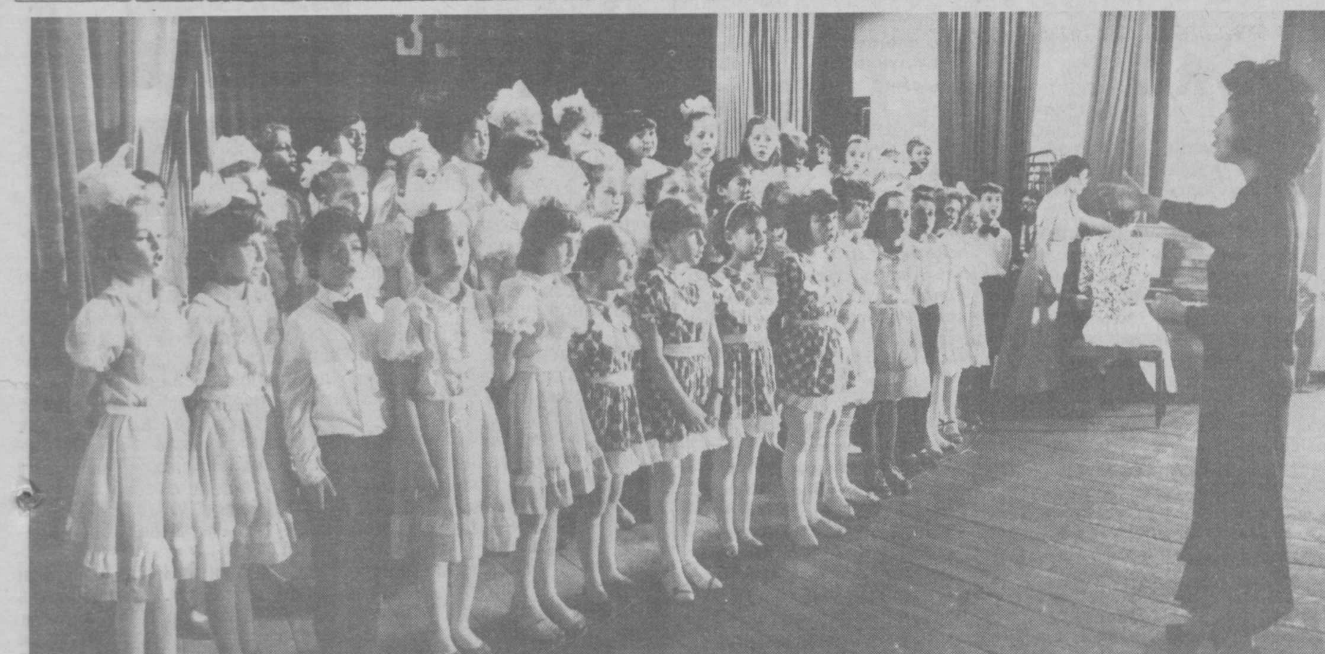
Школа: время перемен