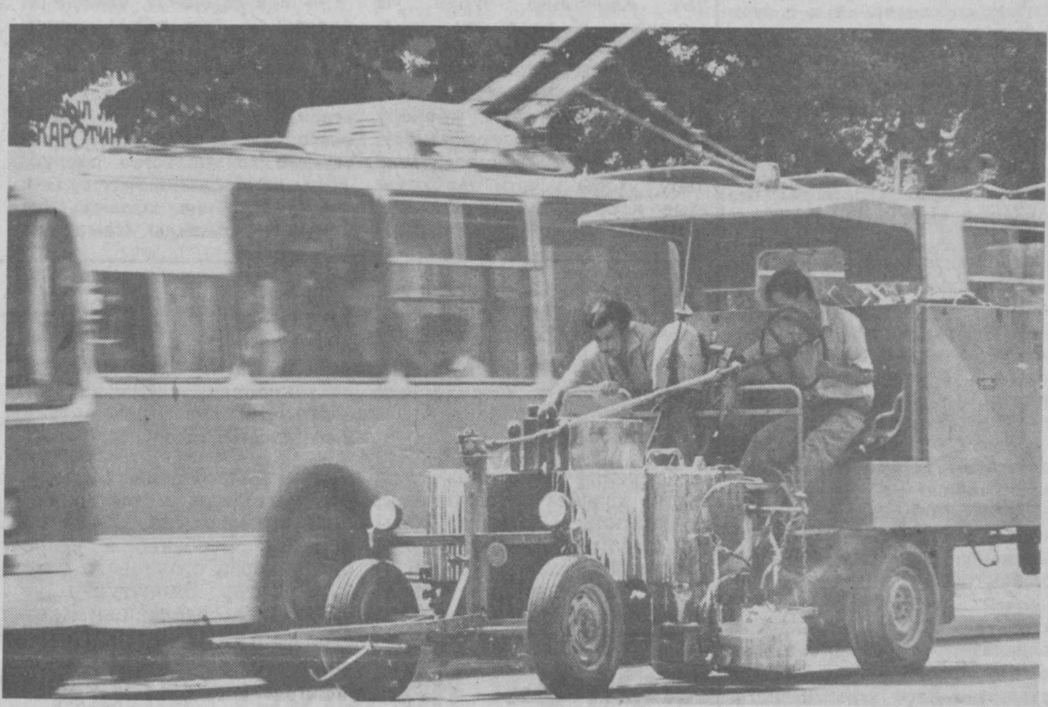
«Художники» ташкентских дорог.

В латвийском городе Огре существует единственный в бывшем Союзе Музей истории и техники автомобильных дорог. Он собирает и хранит историю дорожно-строительного дела, орудия труда дорожников, геодезические приборы и машины прошлых лет, оригинальные фотоснимки, гравюры, карты, открытки и т. д.