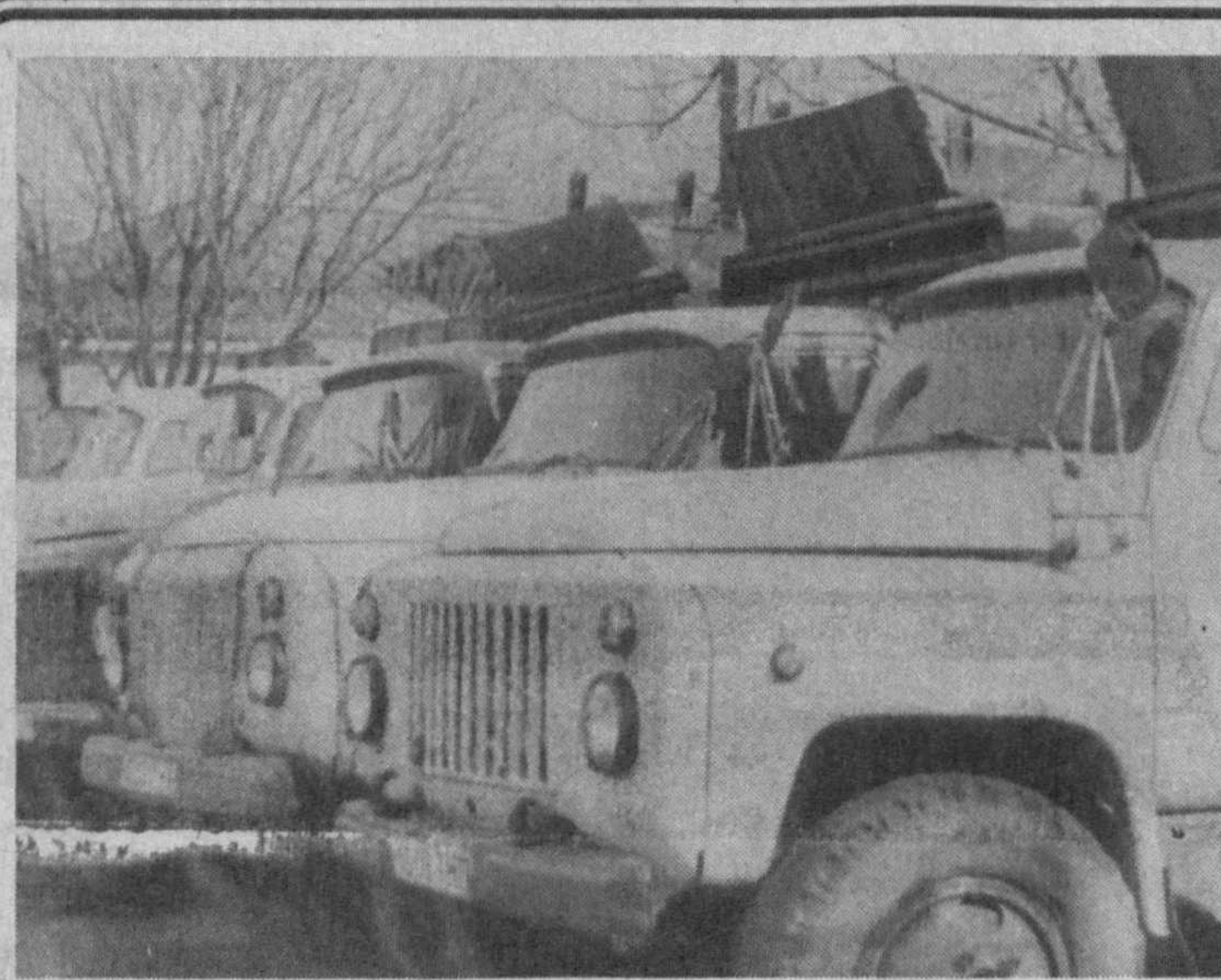
Город и его проблемы