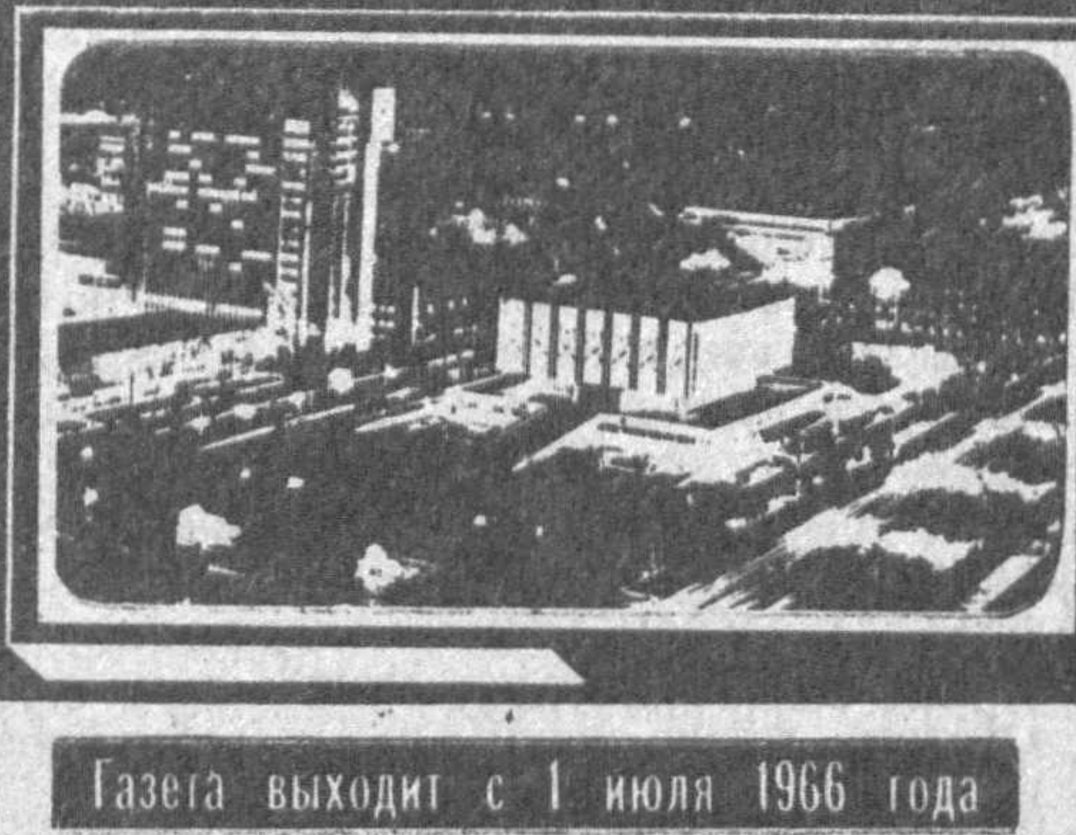
Газета выходит с 1 июля 1966 года