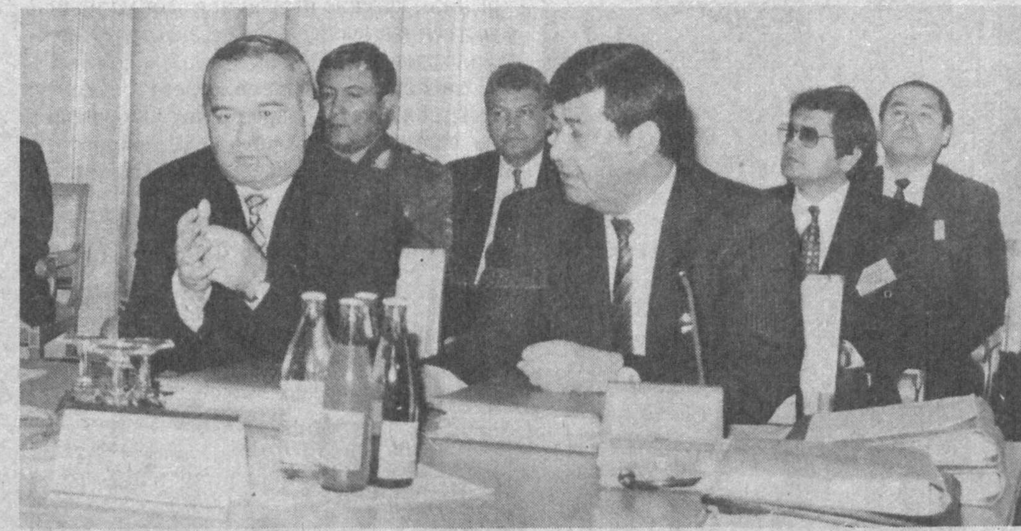
НА СНИМКЕ: во время встречи.

В столице Казахстана 10 февраля состоялась очередная встреча глав государств и правительств стран-членов Содружества Независимых Государств. В ней приняли участие 12 делегаций стран Содружества. Президент Узбекистана Ислам Каримов, отвечая на вопросы журналистов в аэропорту города Алматы, еще раз подтвердил, что интеграция в рамках СНГ является требованием времени.