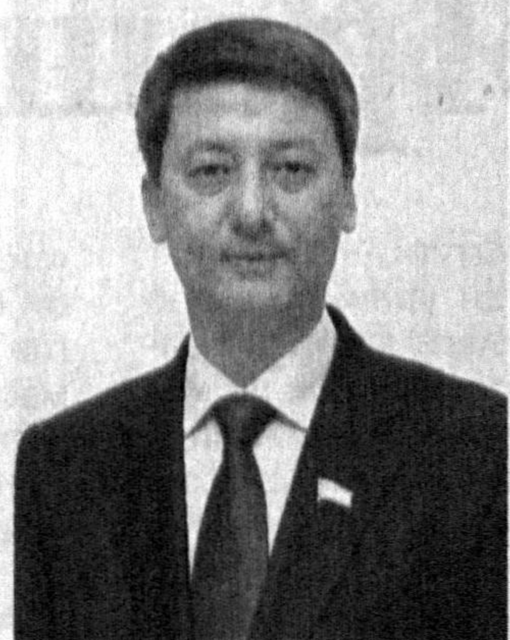
Тўлқин ТУРСУНОВ, Олий Мажлис Қонунчилик палатаси депутати

тон давлат мустақиллигига эришиши билан демократик ҳуқуқий давлат ва фуқаролик жамияти қуриш йўлини танлади.