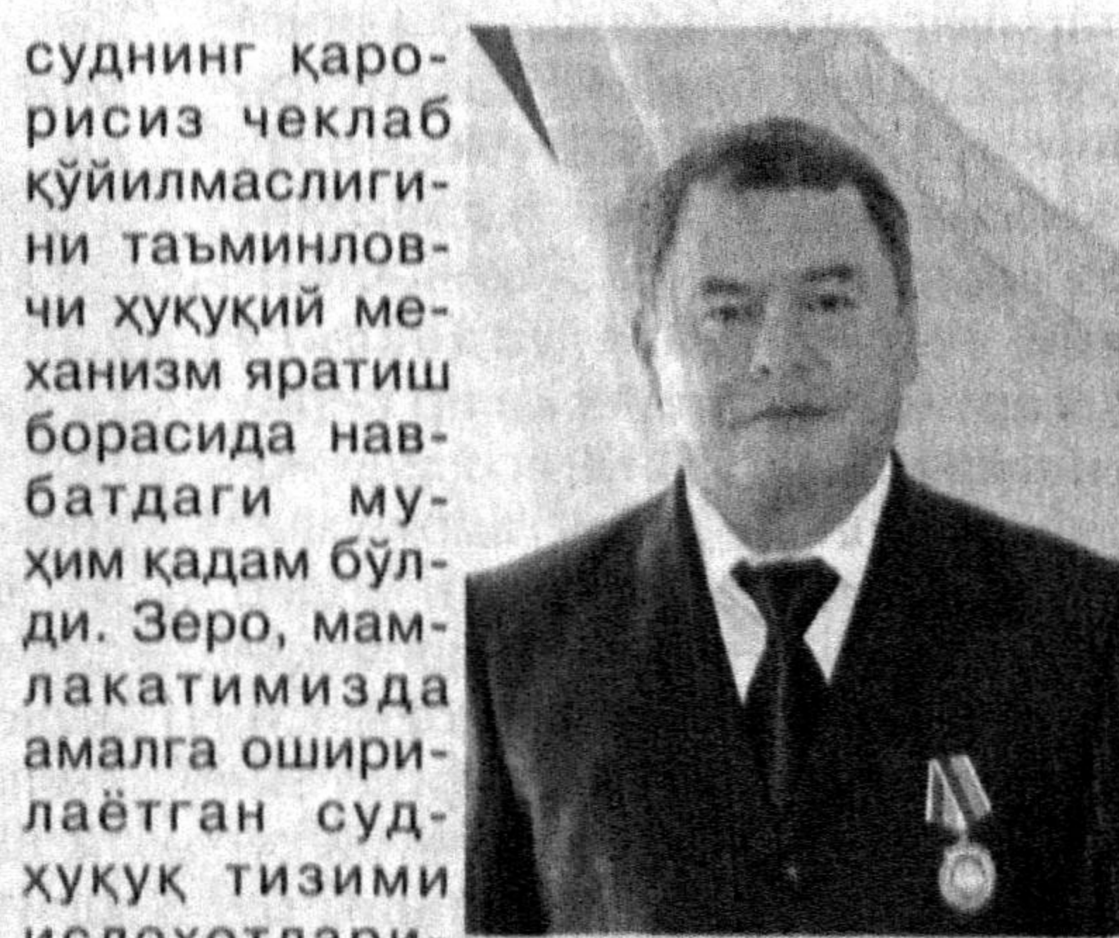
Арслон УСМОНОВ, Олий суд судьяси

Суд-ҳуқуқ тизимини ислоҳ қилиш ва либераллаштиришга қаратилган чоратадбирлар босқичма-босқич тарзда такомиллаштириб борилаётган. Мамлакатимизда ўлим жазосининг бекор қилиниши юртимизда инсон ҳуқуқлари, эркинликлари ва қонуний манфаатлари устувор қадрият сифатида эъозланаётганининг яққол ифодаси бўлди. Қамоққа олишга санкция бериш ҳуқуқининг судларга ўтказилгани фуқароларнинг ҳуқуқ ва эркинликларини