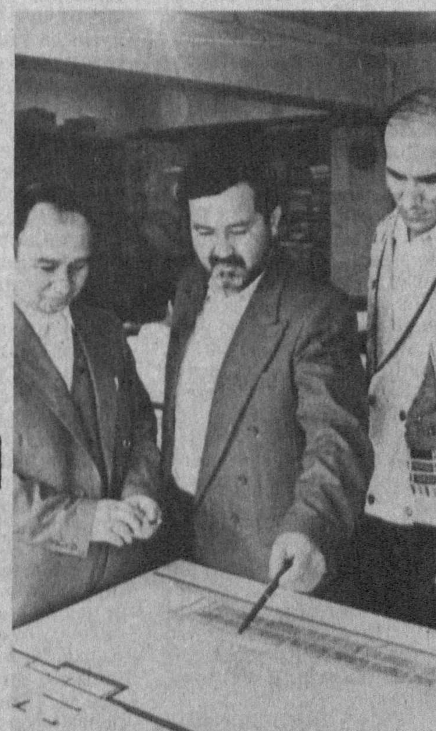
настажной подземной части разместятся хранилища, подсобные помещения, а в двухэтажной надземной — экспозиция музея, лекционные залы, библиотека.

Итак, творческий поиск продолжается. Знание музея будет круглой формы, шестидесяти метров в диаметре. В од-