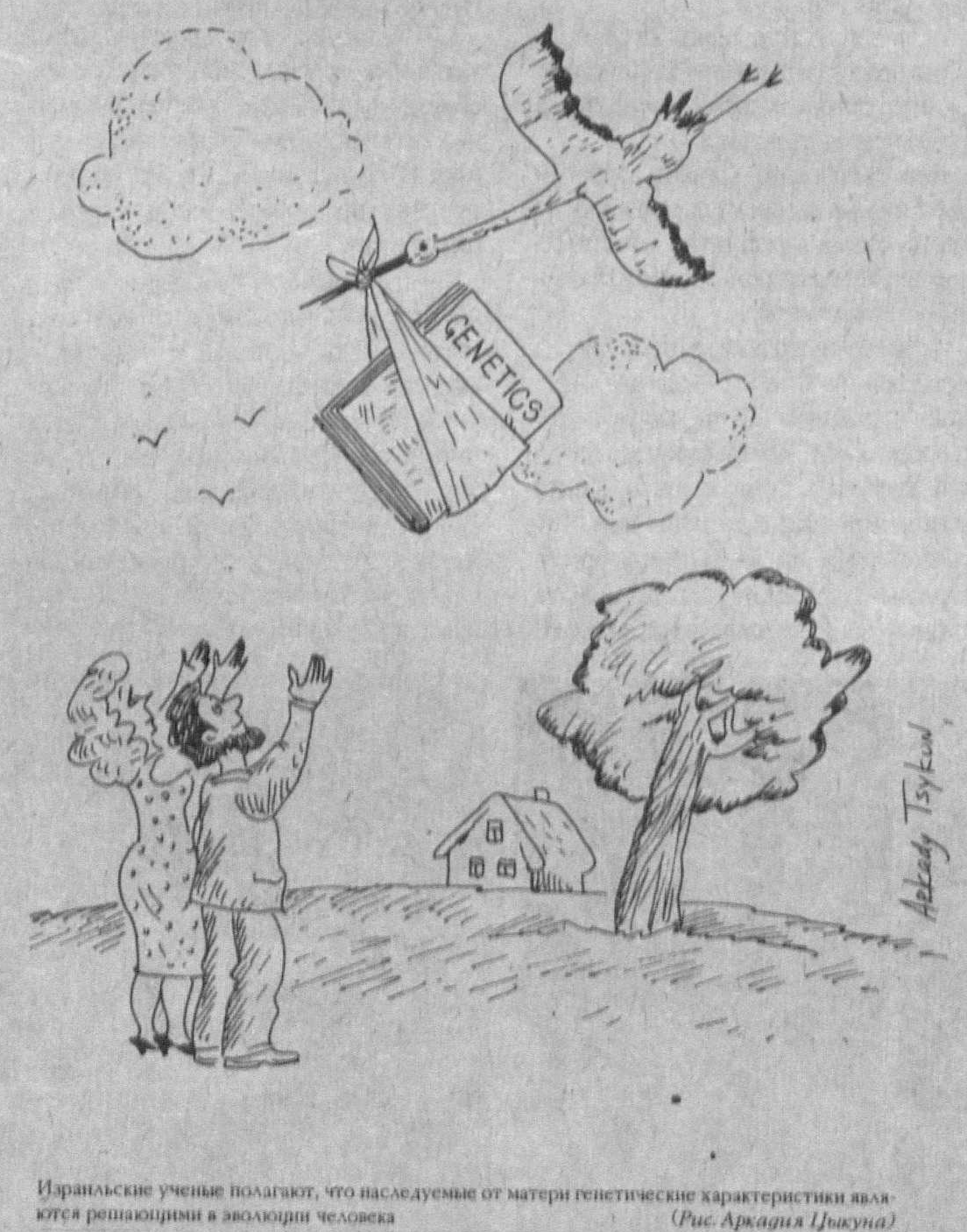
Израильские ученые полагают, что наследуемые от матери генетические характеристики являются решающими в эволюции человека. (Рис. Арнаста Цукунда)

По мнению израильских ученых, открытие импринтных генов имеет особую важность для понимания развития человека как биологического вида, а также для выяснения причин ряда заболеваний. Как выяснилось, активизация деятельности импринтного гена «неправильного» родителя вызывает некоторые формы рака у детей, а также другие заболевания. Таким образом, информация о «половой принадлежности» гена и его воздействии, о месте локализации в хромосоме оказывается чрезвычайно важной для понимания причин заболеваний и разработки методов их лечения и профилактики. (Иерусалимформ).