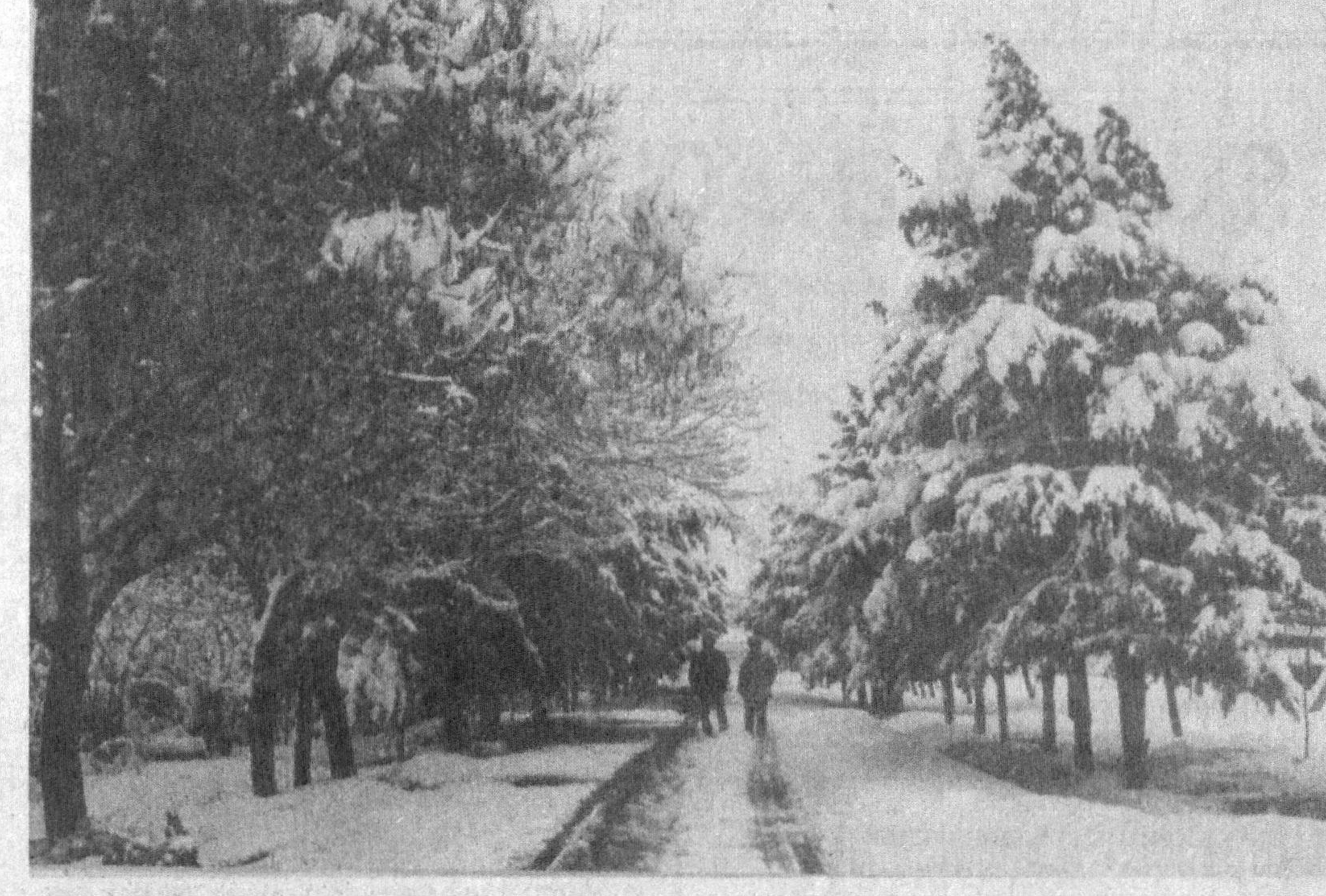
ТОШКЕНТДА ЯНА ҚОР...