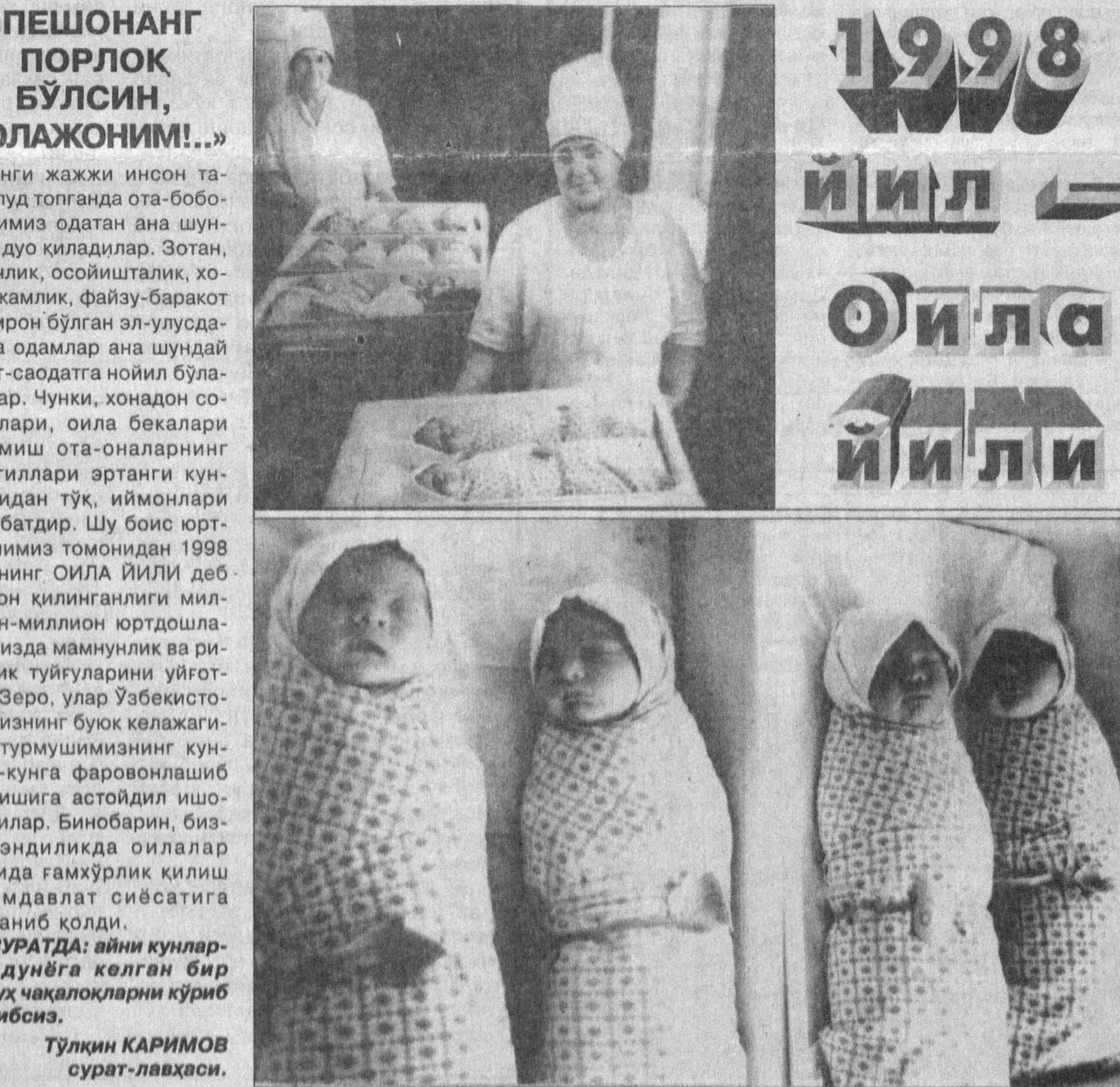
«ПЕШОНАНГ ПОРЛОҚ БЎЛСИН, БОЛАЖОНИМ!...»

Янги жажжи инсон таваллуд топганда ота-боболаримиз одатан ана шундай дуо қиладилар. Эотан, тинчлик, осойишталик, хотиржамлик, файзу-баракот ҳукмрон бўлган эл-улусдагина одамлар ана шундай бахт-саодатга нойил бўладилар. Чунки, хонадон соҳиблари, оила бекалари бўлмиш ота-оналарнинг кўнгиллари эртанги кунларидан тўқ, йймонлари ижобатдир. Шу боис юртбошимиз томонидан 1998 йилнинг ОИЛА ЙИЛИ деб эълон қилинганлиги миллион-миллион юртдошларимизда мамнулик ва ризозлик туйғуларини уйғотди. Зеро, улар Ўзбекистонимизнинг буюк келажига, турмушимизнинг кундан-кунга фаровонлашиб боришига астойдил ишонадилар. Бинобарин, бизда эндиликда онлалар қақида ғамхўрлик қилиш умумдавалт сиёсатига айланиб қолди. СУРАТДА: айни кунларда дунёга келган бир гуруҳ чақалоқларни кўриб туриш.