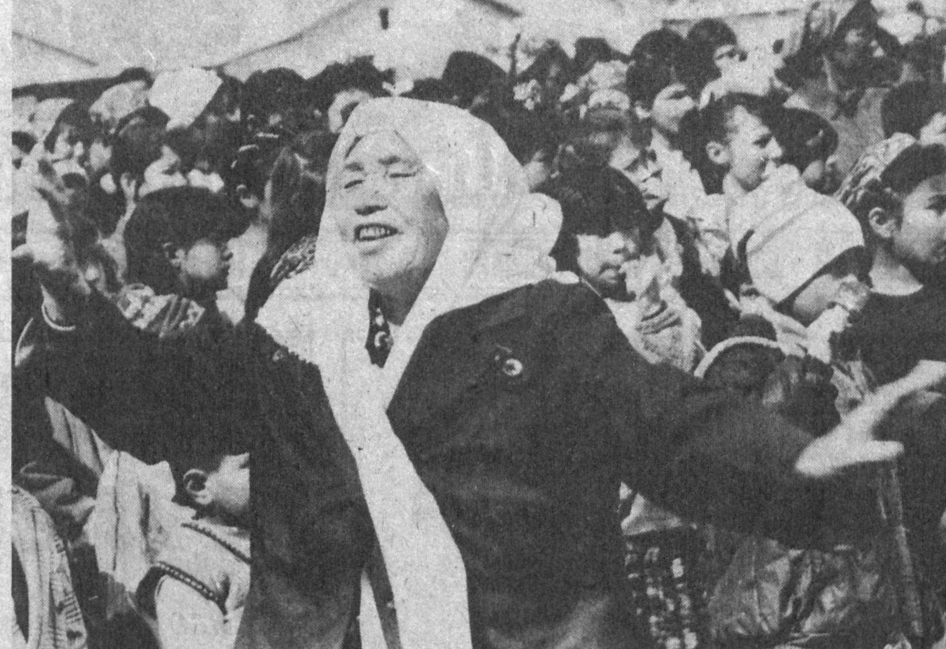
(Давоми. Боши 1-бетда).

ларига ҳам катта байрам дастурхони ёзилган эди. Айём куни шаҳар ҳокимлиги ва қатор жамоатчилик ташкилотлари вакиллари кам таъминланган 150 оила ҳамда ногиронлар, нафақахўрлар хонадонларига бориб, уларга ҳар бири 1,5 минг сўмдан озиқ-овқат маҳсулотлари тортиқ қилди. "Қамолот", "Қизил ярим ой", "ЭКОСАН" ва бошқа жамғармалар хайрия тadbирларида фаол қатнашди. Улар болалар уйлари тарбияланувчиларига, етим-есирларга юзларча минг сўмлик турли кийим-кечаклар, пойабзаллар совға қилди. Саноат корхоналари, қурилиш ва транспорт ташкилотлари, муассасалар маъмуриятлари ҳам ўз фахрийлари учун дастурхонлар ёздилар, турли шаклда моддий ёрдам кўрсатдилар.