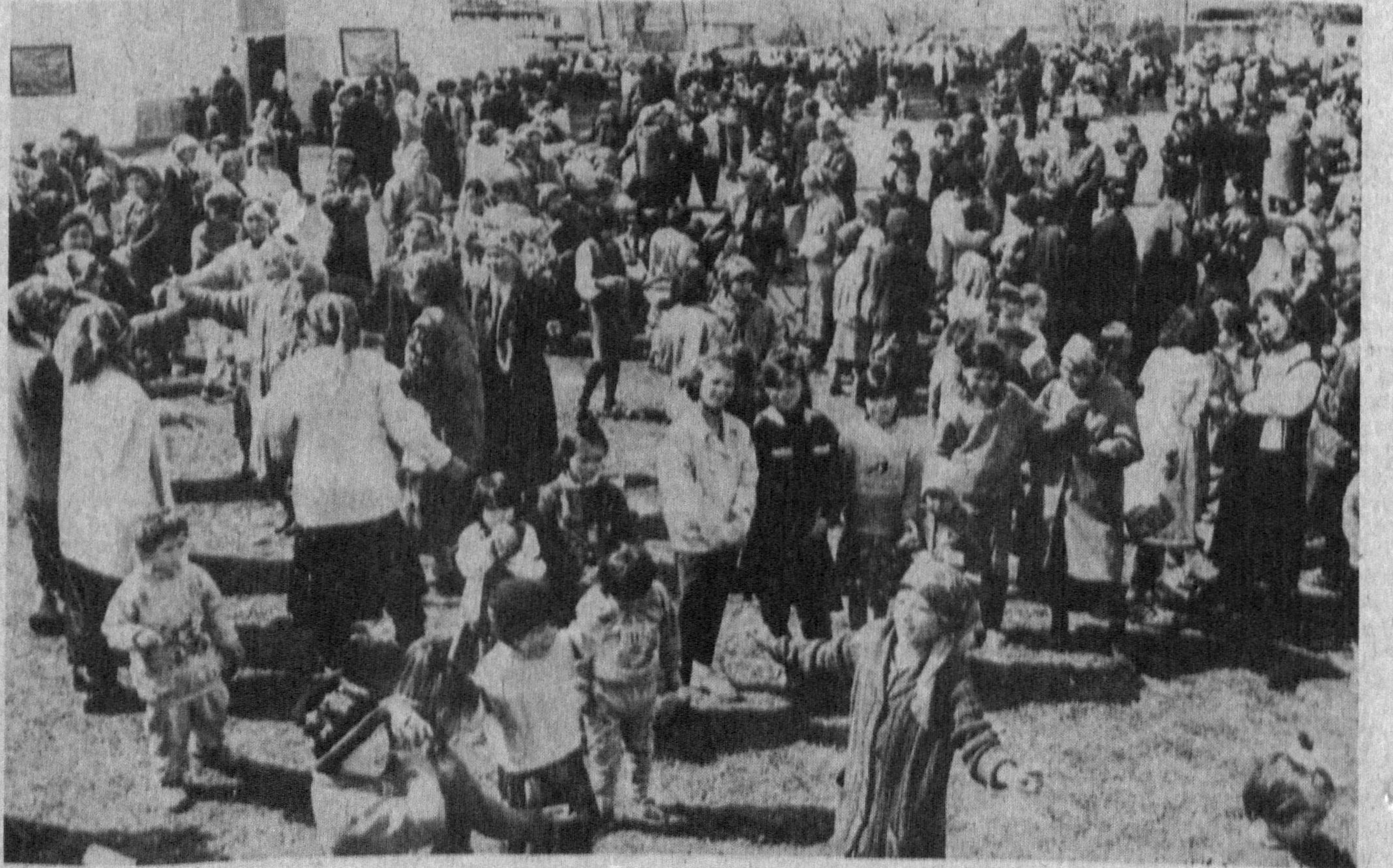
Суратларда: Наврўз тантаналаридан лавҳалар.