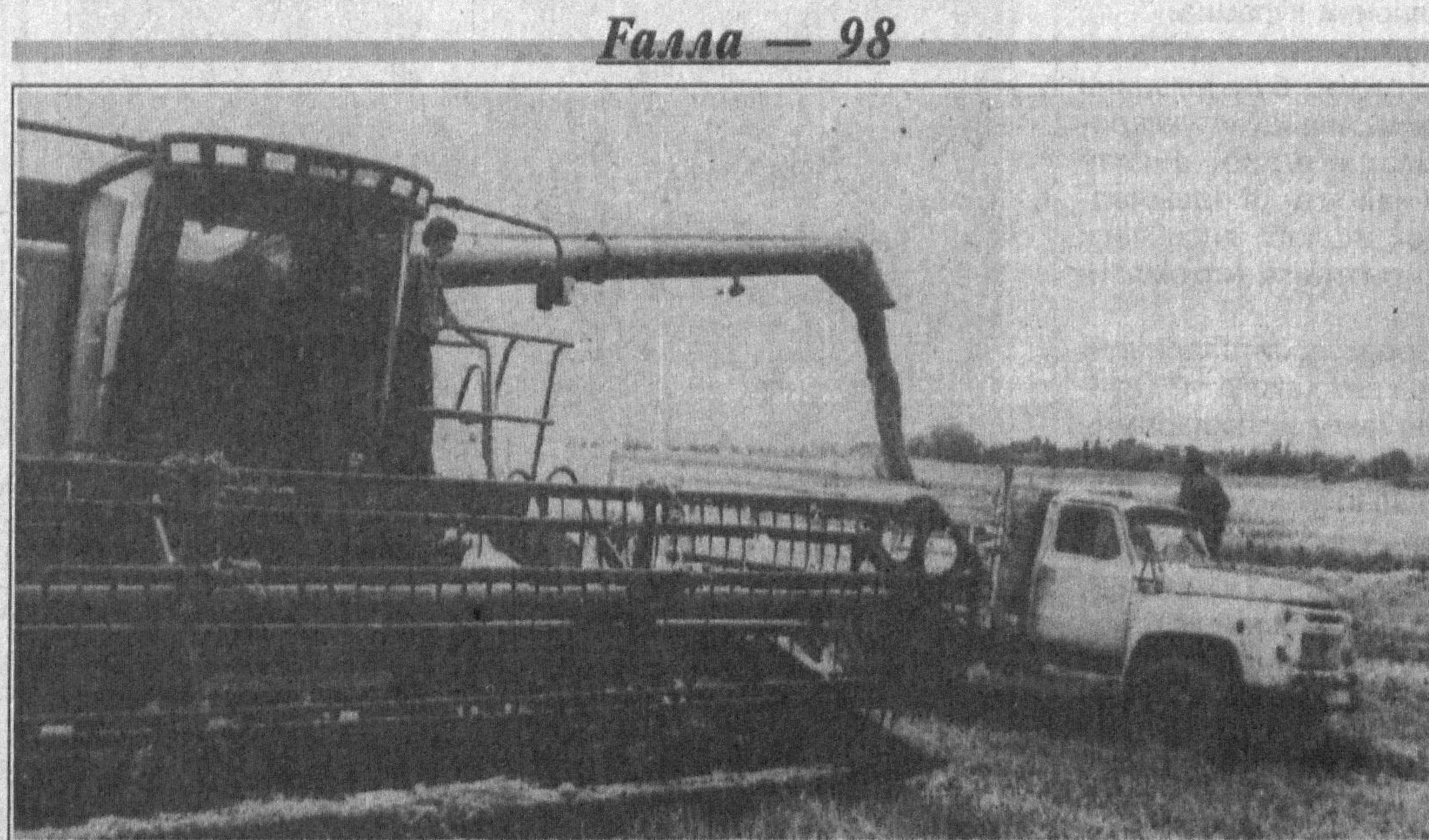
ҲАР ЙИЛДАГИДЕК бу йил ҳам Янгийўл туманидаги кўп тармоқли "Тинчлик" ширкат ҳўжалигида галладан мўл ҳосил этиштирилди. Айни кунларда ўрим-йғим қизғин бормоқда. Дастлабки ҳисоб-китобларга қараганда, ҳар гектардан ўртача 40 центнердан ҳосил йиғиштириб олинмоқда.