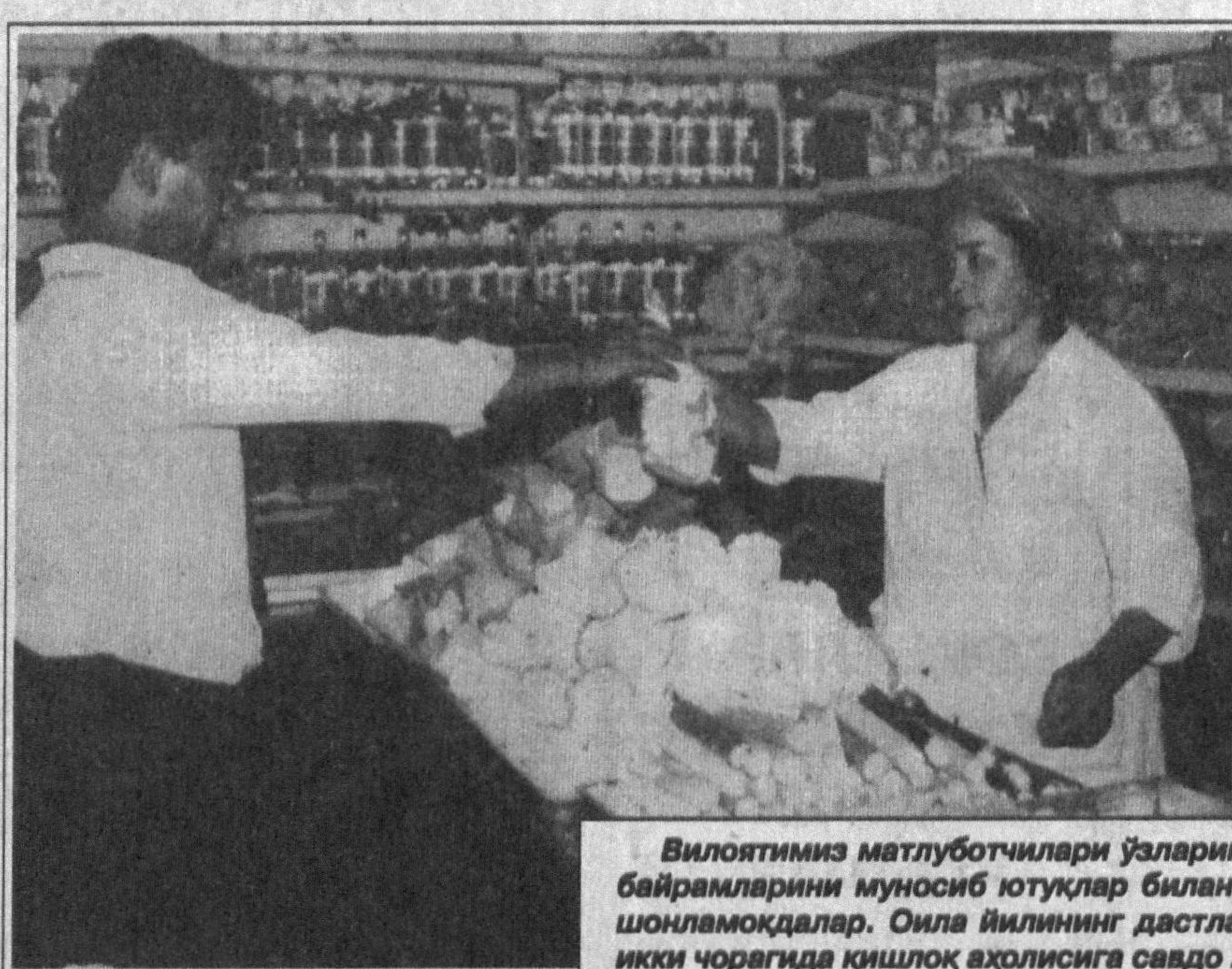
Виллоятимиз матлуботчилари ўзларининг байрамларини муносиб ютуқлар билан нишонламоқдалар. Ойла йилнинг дастлабки икки чоракда кишлоқ аҳолисига савдо хизмати кўрсатиш даражаси анча ошди.