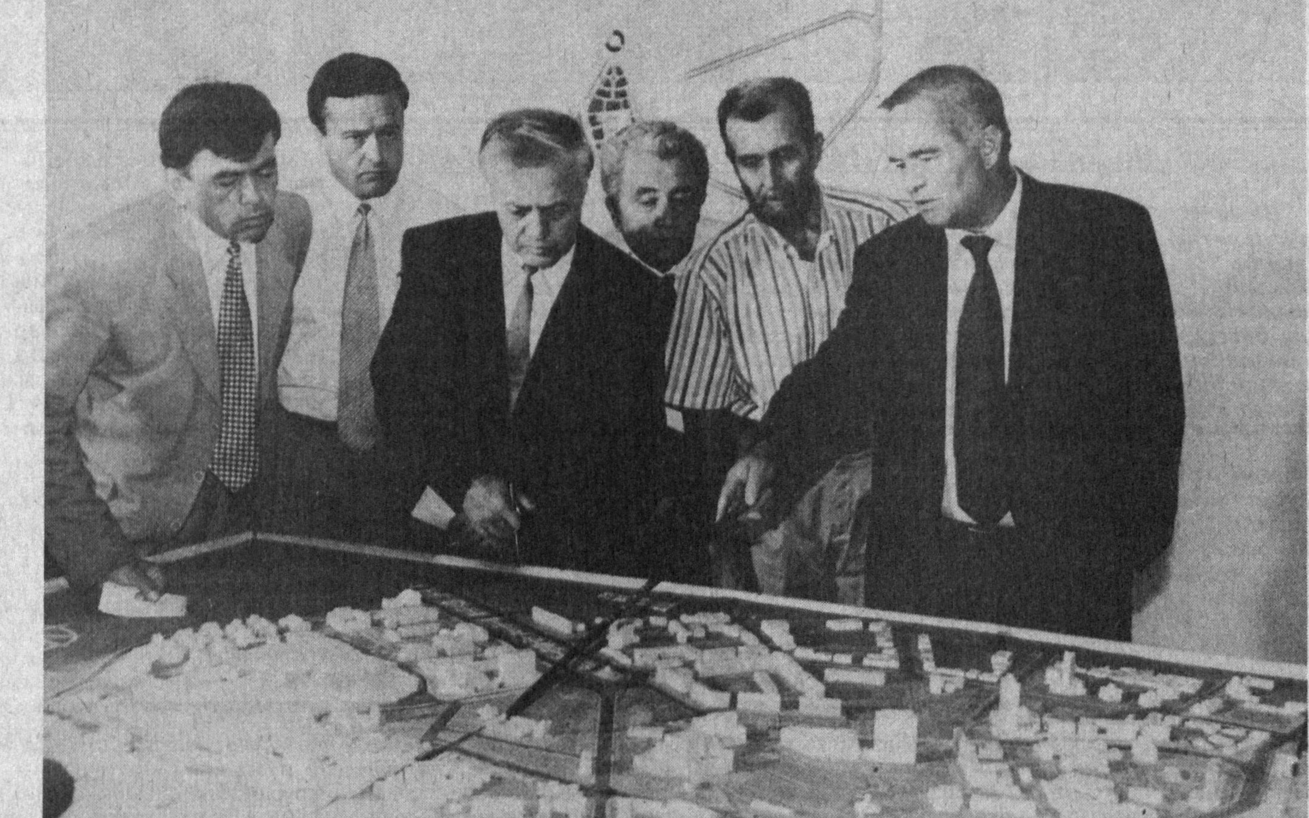
СУРАТДА: мамлакатимиз раҳбари Самарқанд шаҳри қурилишининг янги бош лойиҳасини кўздан кечирмоқда.