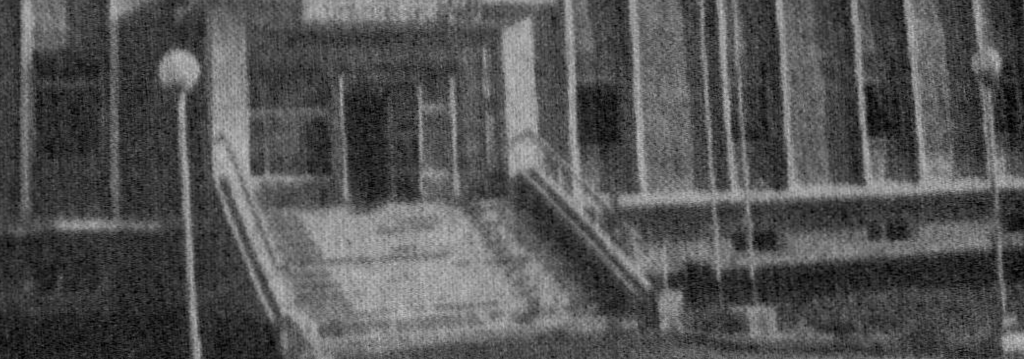
Сиз суратда қўриб турган ушбу замонавий мактаб биноси Тошкент туманидаги Охунбобоев номи жамоа хўжалигида бунёд этилди; Паркент туманидаги шарқона услубда қурилган бинолар ва Куйичирмақдаги Ўзбекистон — Туркия қўшма корхонаси ҳам 1998 йилнинг обидаларидир.

Айни кунларда тахририятимизга тўхтовсиз кўнгирақлар бўлмоқда, мактублар келиб турибди. Уларнинг аксарияти байрам арафасида ишга туширилаётган мана шундай объектлар тўғрисида хабар бермоқда. Бу ҳали ҳаммаси эмас. Айём муносабати билан жойларда ўтказилаётган шанбаликлар, ободончилик ишлари ҳам диққатга сазовордир. Бир сўз билан айтганда вилоят байрамга ҳозирланмоқда. Ҳозирланганда ҳам алоҳида, кўтаринки руҳ, шўқуҳли шўур, фахр-ифтихор билан ҳозирланмоқда. Зеро, шаҳар ва туманларда шунга арзиғулик ишлар, ютуқлар, муваффақиятлар, энг асосийси ажойиб меҳнаткаш инсонлар бор.