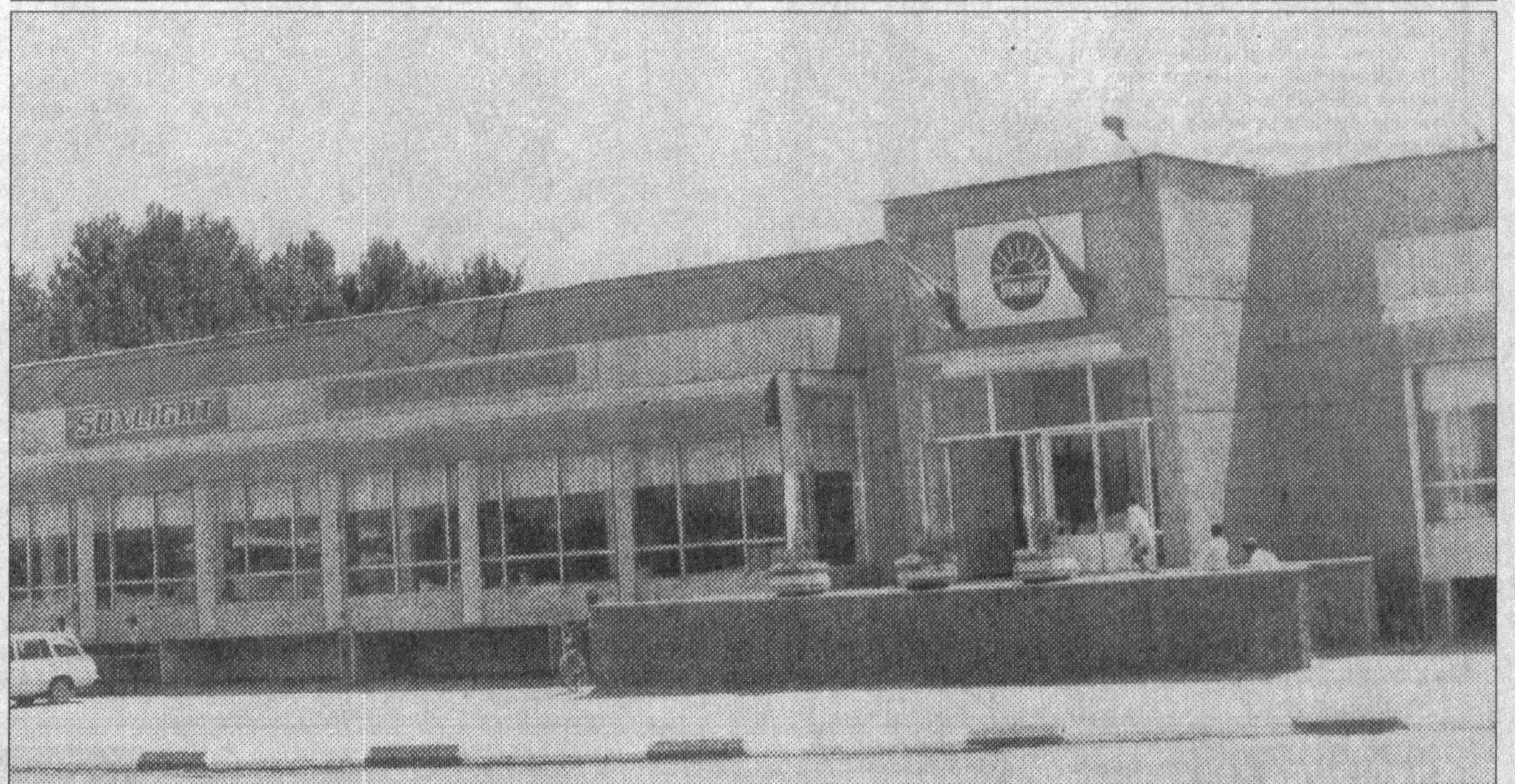
► 1998 йилда вилоятимиз ўзДЭУватонинг 8та янги шахобчаси меҳнаткашларга хизмат кўрсата бошлади. Сиз суратда (оқорида) кўриб турган барча қулайликларга эга бўлган автодўкон Заңгиота туманида бунёд этилди; истиқлолимизнинг еттинчи йилида Ўзбекистон - Хитой ҳамкорлигида барпо этилган «Санлайт» қўшма корхонасининг маҳсулотлари ҳам тобора ҳаридорғир бўлиб бормоқда.