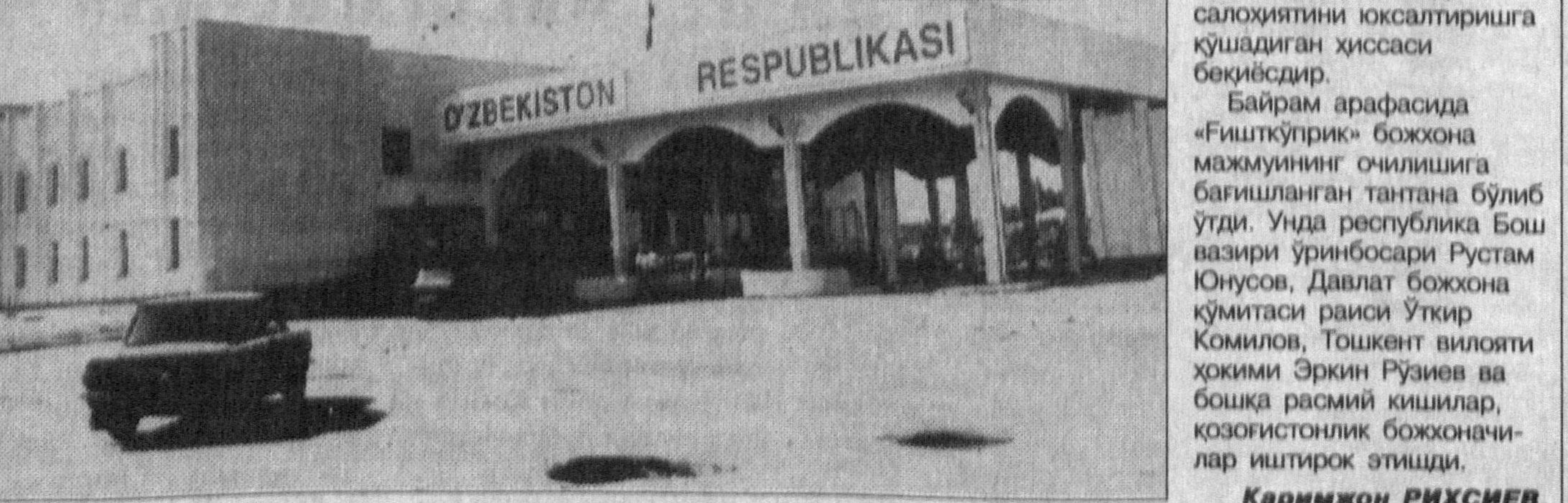
СУРАТДА: янги божхона маскани.

ри инфратузилмасини ривожлантириш, ҳусустан, барча кулайликларга эга бўлган замонавий божхона иншоотлари қурилишига катта эътибор берилмоқда. Утган йили жаҳон талабларига тўлиқ жавоб берадиган «Олот» божхонаси қурилиб фойдаланишга топширилди. Худди шундай усулда қурилган «Сариосиё» божхона мажмуи яқин кунларда иш бошлайди. Мустақиллик байрами арафасида эса, Ўзбекистон ва Қозғистон chegarасида «Фишкўприк» божхона мажмуи очилди. Ҳисоб-китобларга қараганда ушбу божхона постидан кунига ўрта ҳисобда 4-5 мингта энгил автомашина, 90-100 та автобус, 70-80та юк машиналари ўтади.