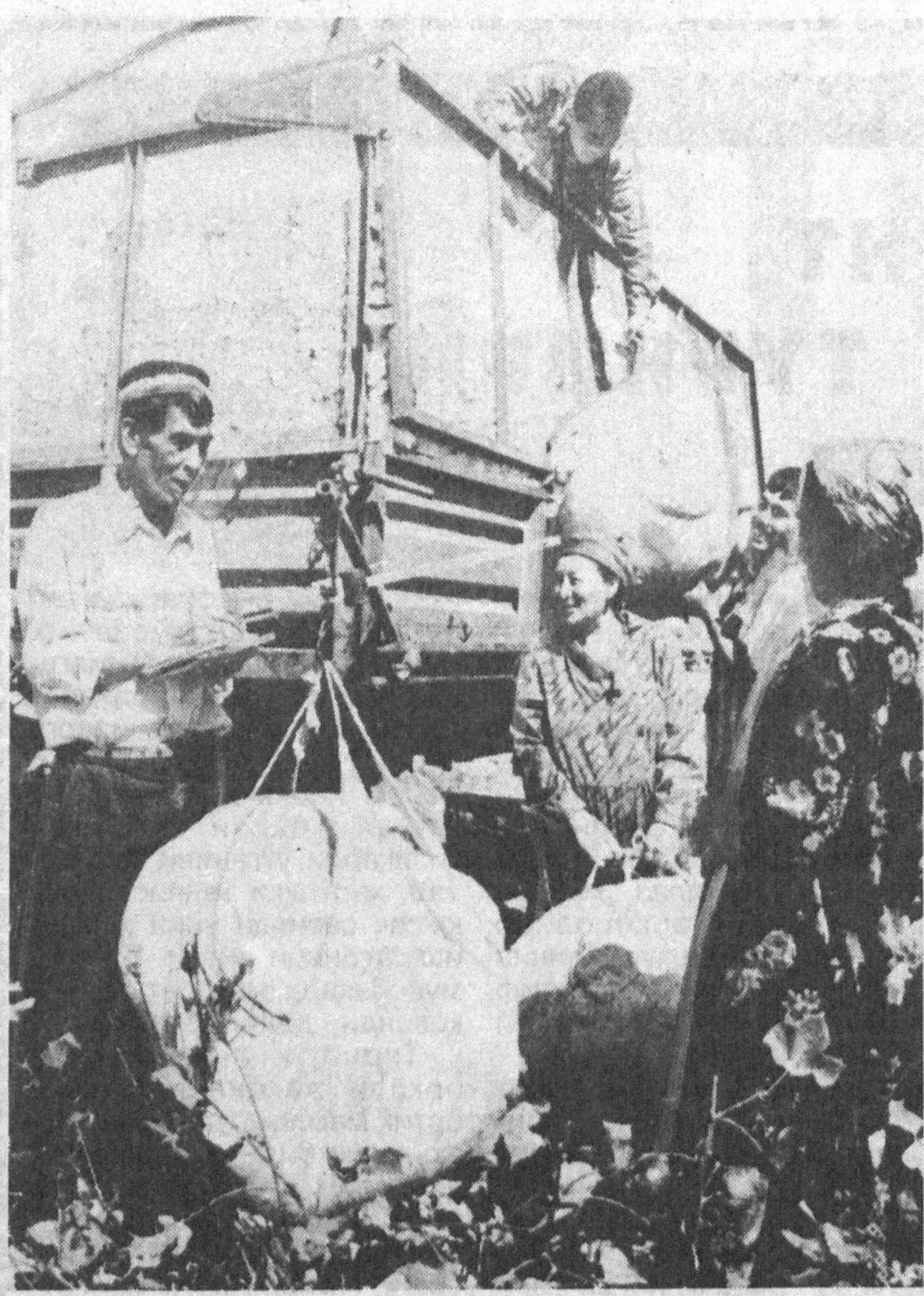
Оққўрғон тумани теримда иштирок ҳужаликлариде пахтани этайтган, хирмонда қўлда териш бошлаб ишлаётган, ҳосилни ора-юборилди. Мухим ишга тиш, ташиш, тушириш пухта ҳозирлик қўрилган, билан банд бўлганларга