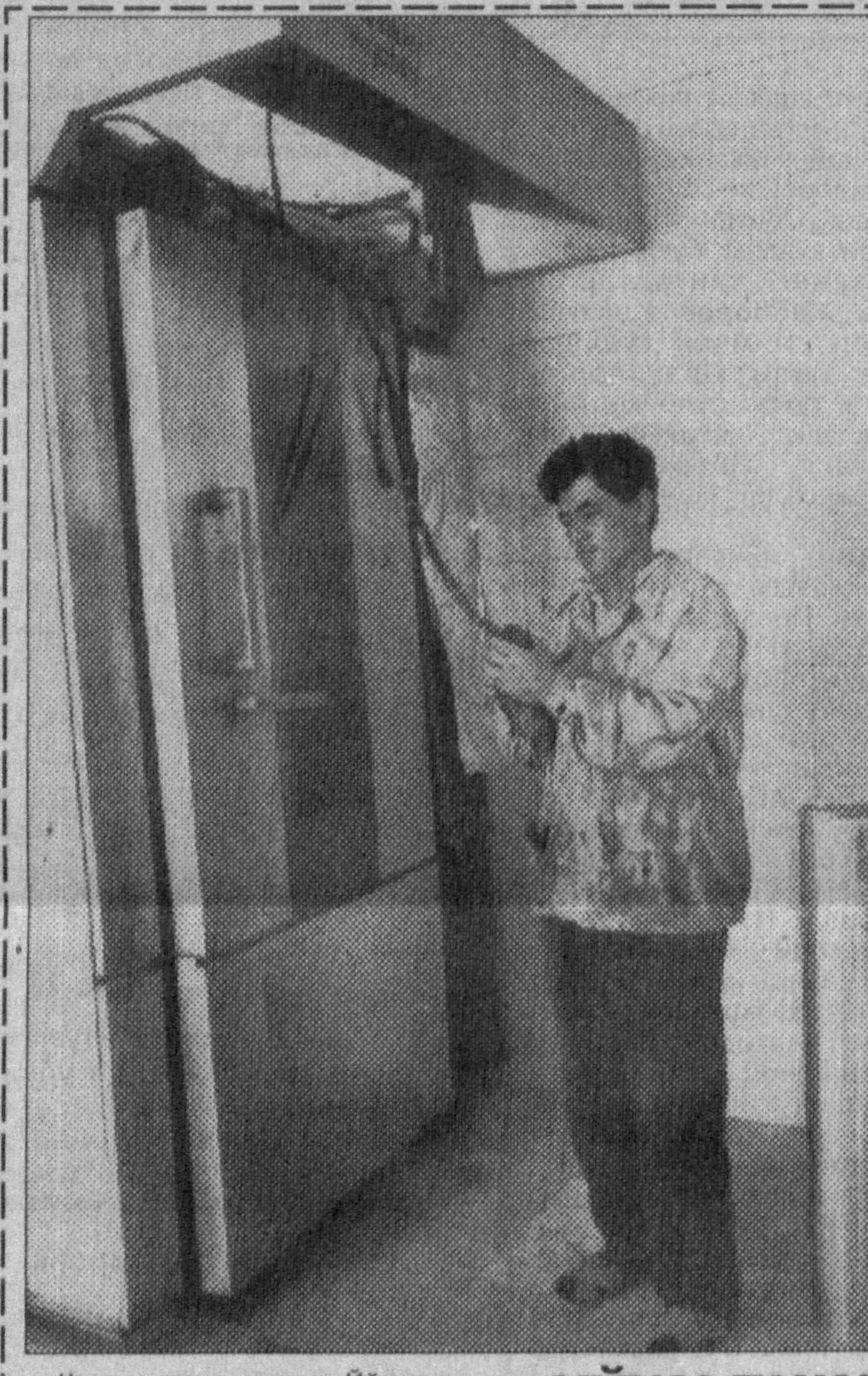
Чиноз туманидаги йўлдош Охунбобоев номли жамоа ҳўжалиғида нон ишлаб чиқариш корхонаси урулиши иқтисога етмоқда. Уни барпо этишда қатнашган асосий пудратчи «Олтин хирмон» бинокорлик ташкилотини жамоаси заводи жорий йилнинг ноябрь ойида фойдаланишга

ДУШАНБЕ. БМТ Бош Қотибининг Афғонистондаги махсус вакили Лакшар Брахими Тожикистонга келди. У президент И. Раҳмонов ҳамда тақдим ишлар вазири, шунингдек, Душанбедаги дипломатик корпус вакиллари билан учрашди. Учрашуларда Афғонистондаги бугунги вазият ва уни тинч йул билан ҳал қилиш имкониятлари ҳақида фикрлашилди. Бу масалада Тожикистоннинг нуқтани назари аниқлаштирилди.