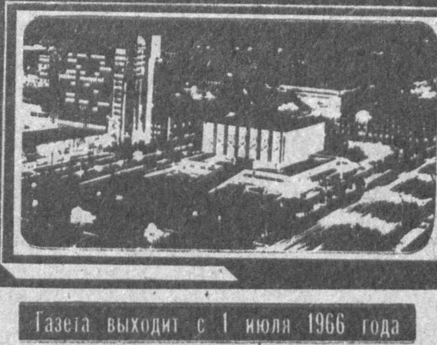
Газета выходит с 1 июля 1966 года