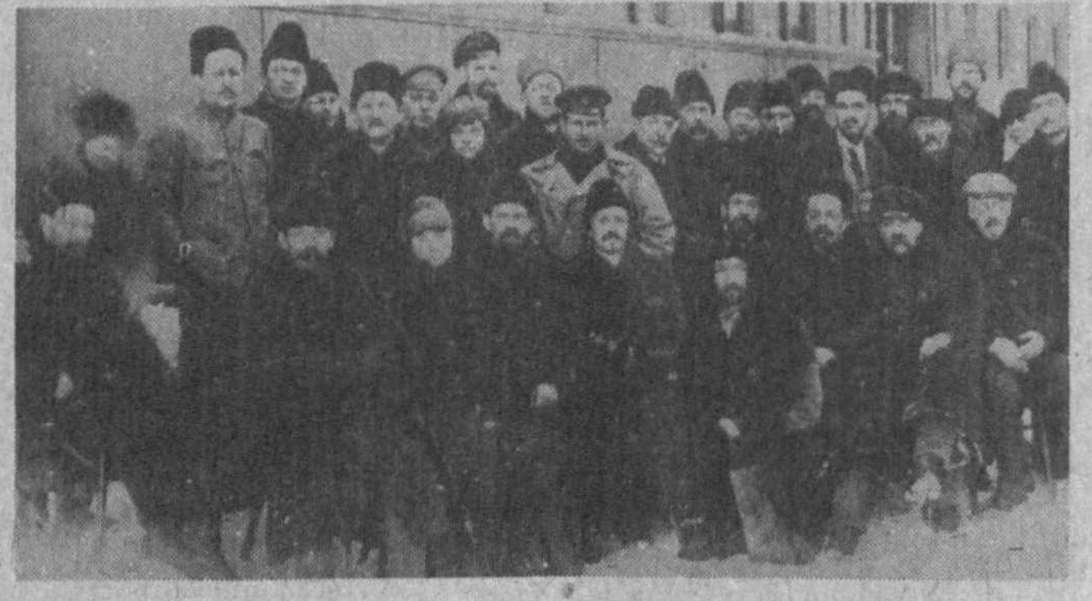
К своему делу, преданность науке.