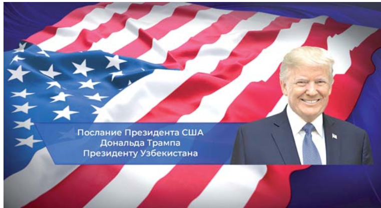
Послание Президента США Дональда Трампа Президенту Узбекистана