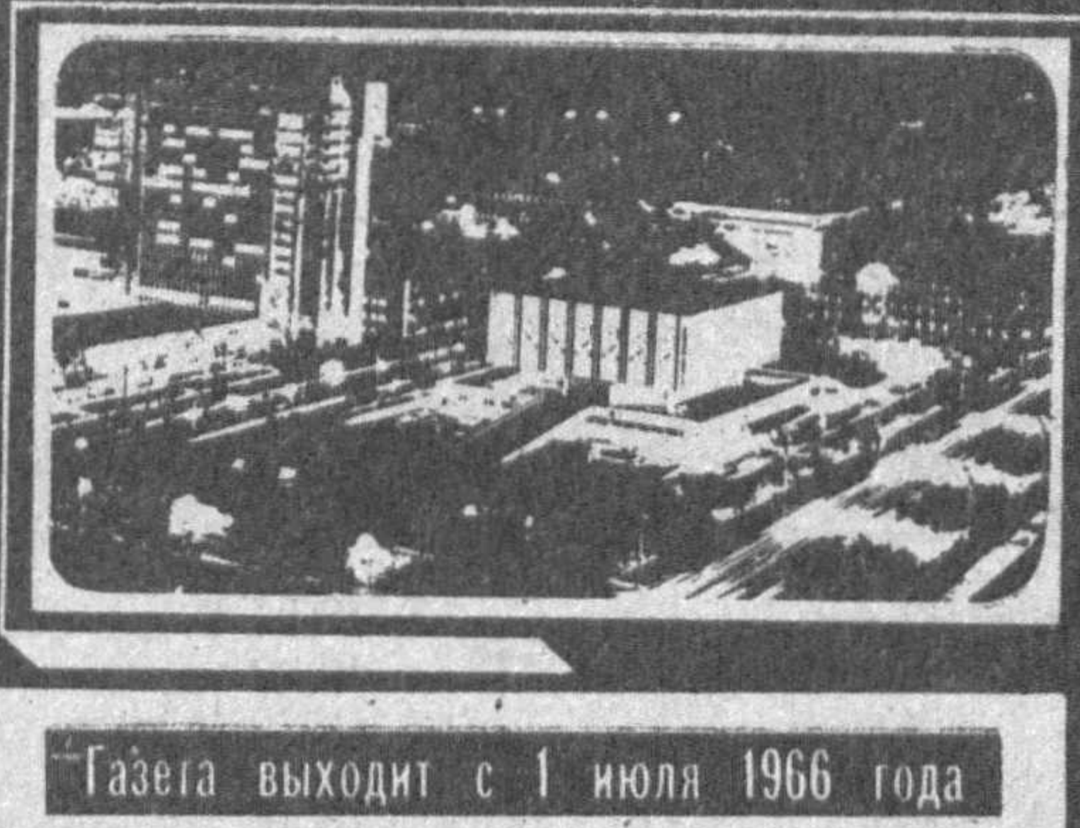
Газета выходит с 1 июля 1966 года